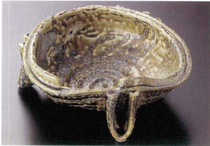
19-1-24B 2,800円 桑根織部変形三つ足盛鉢 40入 18.5×18×7.6cm