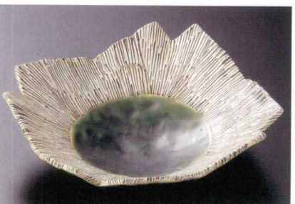
19-10-24B 2,500円 織部十草四切向付 60入 17×4cm