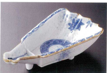
19-8-52B 2,600円 染付春秋丸紋扇面向付 40入 22.3×11.6×5.5cm