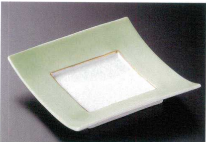
19-4-11B 2,200円 ヒワ淵正角皿 60入 16.8×16.8×3.5cm