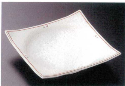
19-5-11B 2,350円 朱金ラスター正角5.5皿 60入 16.5×16.5×4cm