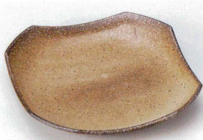
グレーマット京四方

190-8-21B 1,200円 正角前菜皿(小) 40入 18×18×3cm 190-9-21B 1,900円 正角前菜皿(大) 30入 22×22×3cm