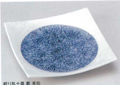
紋り乱十草 藍 手引

190-1-43B 380円 正角4.5皿 120入 13.5×13.5×2.8cm 190-2-43B 630円 正角5.5皿 100入 17.3×17.3×3cm 190-3-43B 1,800円 正角7.5皿 60入 23×23×4.2cm