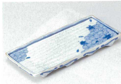
194-4-52B 5,000円 染付春秋長角尺3皿 15入 39.6×16.9×3.5cm