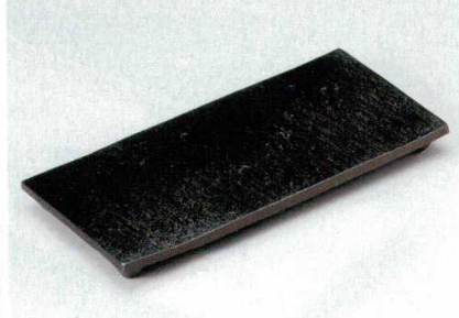
194-3-24B 6,300円 黒陶石目板皿 31.5×13.8cm