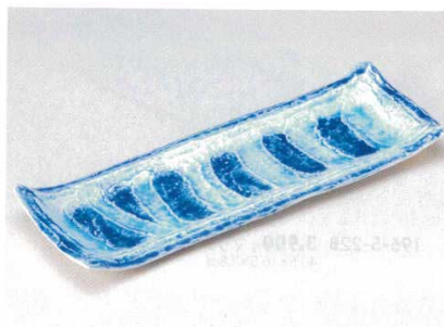
195-5-23B 5,000 円 マリンブルーガタ彫大長皿 16入 46.5×16.5×3.8cm