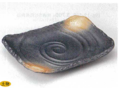
土物 195-10-29B 5,300 円 黒備前足付盛皿(大) 20入 32×23.3×4.5cm