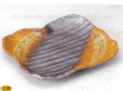
土物 195-11-84B 4,800 円 南蛮一珍12号角大皿 10入 37×31×4.7cm