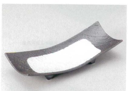
195-9-22B 4,500 円 黒釉青磁流13.5大盛皿 10入 41×16×7.6cm