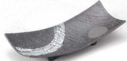
土物 195-3-21B 6,200 円 銀河長角大盛皿 15入 41.5×16.5×9.2cm