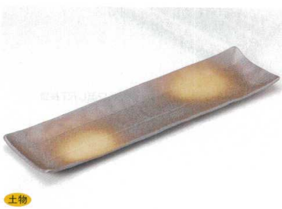
土物 195-8-43B 4,500 円 うでいたたら長角皿 5入 52×14.2×2.5cm