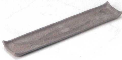
195-1-52B 6,800 円 炭化土クシ目尺八盛皿 10入 52×9.5×2.7cm

特選和食器 和食器単品 和食器オープン 特選洋食器 洋食器オープン 洋食器単品 中華オープン 中華食器単品 西白市及古の器 民芸の器 木竹製器その他