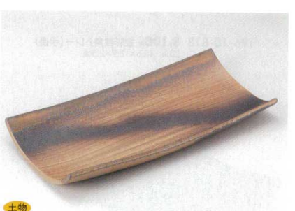
土物 195-12-84B 5,400 円 金彩長角皿(大) 10入 39×19.3×5.5cm