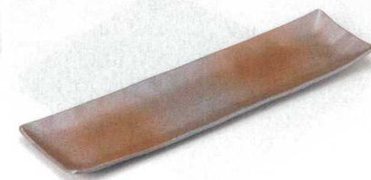
土物 195-2-29B 5,100 円 たたら長皿吹鉄砂 16入 53×14.5×3cm