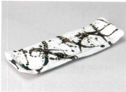
195-4-11B 5,000 円 錆び散らし長角大皿 20入 48×17×4cm