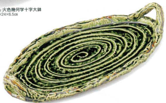
200-9-11B 7,400円 織部うず文手付長盛皿 10入 51×25.5×7.5cm