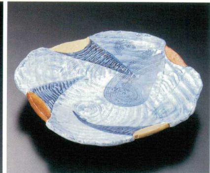
201-3-32B 7,000円 呉須柳目なで角11.0皿 8入 31.5×31.5×5cm