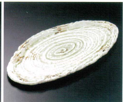
201-6-11B 5,000円 灰釉ビードロうす文楕円盛皿 10入 49×25.5×2.5cm