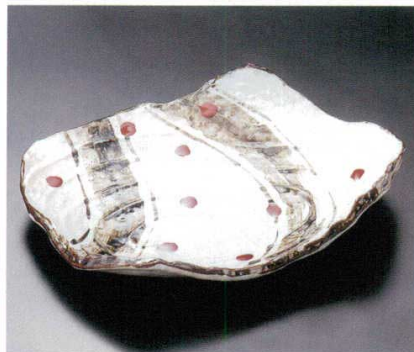
201-8-22B 5,000円 錆絵辰砂渦影尺一盛込皿 20入 35×27×6.5cm