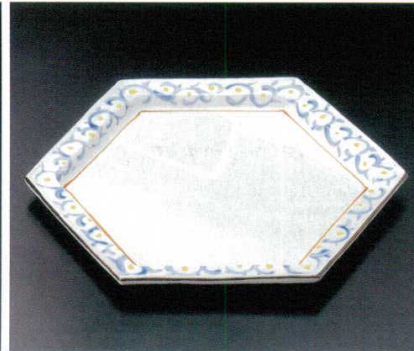
201-2-33B 6,500円 唐草紋六角盛皿 10入 28×23cm