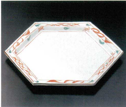
201-1-33B 6,500円 万歴六角盛皿 10入 28×23cm