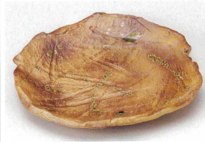
204-8-33B 2,900円 焼メビード口葉形皿大 20入