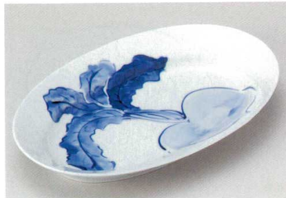
204-7-74B 4,850円 カブラ盛鉢 20入 32.7×21×4.7cm