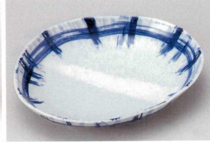
204-9-51B 2,500円 きざら格子盛皿 25入 27.2×23.2×4.8cm