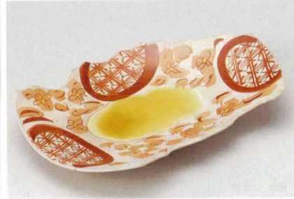
204-6-23B 3,530円 赤絵花ちらしちぎり和皿 20入 29.5×18.8×5cm