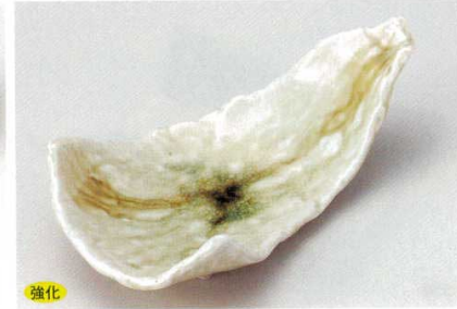
204-11-80B 1,450円 35cm細葉形 30入 35.5×11×3.5cm 204-12-80B 1,800円 40cm細葉形 24入 40.5×12×4.5cm 204-13-80B 2,800円 50cm細葉形 15入 50.5×12.5×3.5cm