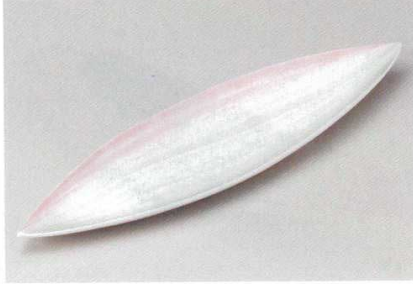
204-2-22B 2,400円 二色 笹型大長皿 44×12×3cm