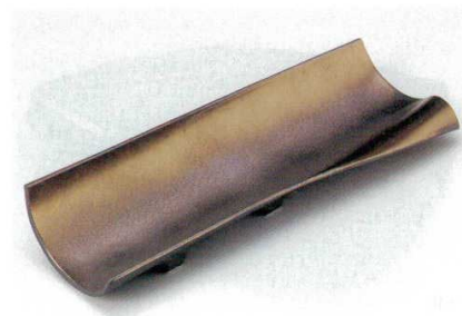
204-10-11B 2,800円 ブロンズうねり盛皿 40入 36.5×13×6.5cm