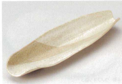
204-5-23B 5,150円 リップルボート 20入 39.8×10.5×6.2cm