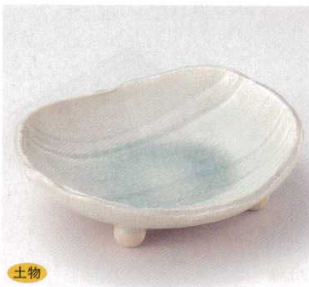
土物 21-7-45B 3,400円 灰釉青磁流線向付(手造り) 40入 16.5×14.5×5cm