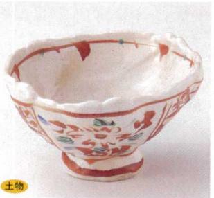
土物 21-19-23B 3,050円 御本手間取小花変型5.0小鉢 36入 15.5×14.5×8.5cm