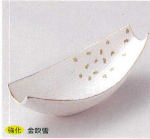
強化 金吹雪 21-1-74B 2,270円 小鉢 80入 17.3×8.1×5.5cm 21-2-74B 3,000円 向付 60入 22.8×10×7cm

特選和食器 和食器単品 和食器オープン 特選洋食器 洋食器オープン 洋食器単品 中華食器単品 四角・五角の器 既製の器 木竹製品その他