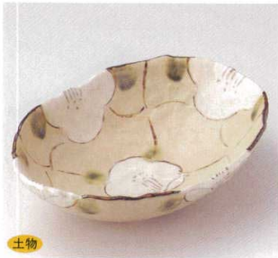
土物 21-6-22B 1,950円 格子花柄円鉢 30入 21.3×15.3×5.5cm