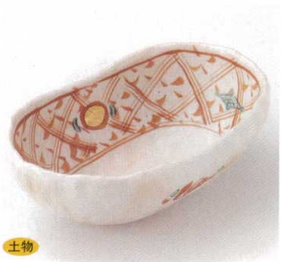
土物 21-17-22B 2,650円 宝珠柄円深鉢 40入 17.6×11×6.3cm