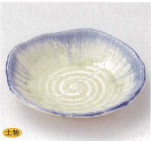
土物 21-11-22B 1,700円 カイラギくしめ波型深皿 40入 18×3.5cm