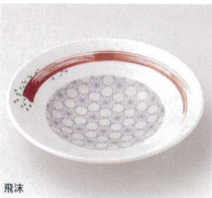
飛沫 21-12-1B 800円 5.0浅鉢 100入 15.7×3.4cm 21-13-1B 1,200円 6.5浅鉢 80入 19.8×4.2cm