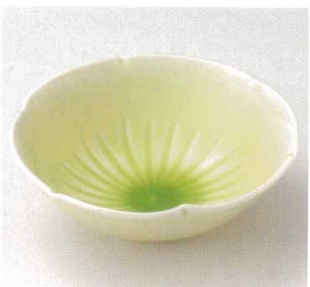
21-14-52B 1,280円 ヒワ袖花型花彫小鉢 60入 15.3×5.1cm