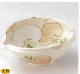
土物 21-22-33B 3,000円 手描紅かぶら片口6.0向付 30入 19×17.5×7.4cm