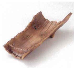
21-5-52B 2,700円 焼締ビードロ竹割型盛鉢 12入 31.7×13.3×8cm