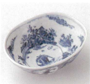
21-9-23B 3,400円 青しめ古染山水柄円向付 50入 17.6×14×7cm