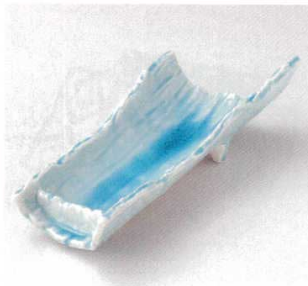
21-4-22B 2,250円 マリンブルー竹割型向付 30.5×13×7.5cm