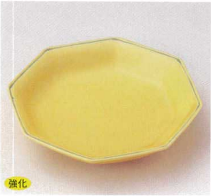
強化 21-10-74B 1,500円 黄交趾八角皿 30入 18×18×3.7cm