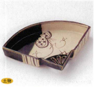
土物 21-15-73B 4,500円 織部唐草5.0扇面鉢 40入 16.5×15.7×3.5cm