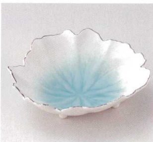
21-8-22B 2,350円 マリンブルー吹木ノ葉型向付 40入 18×16.5×6cm