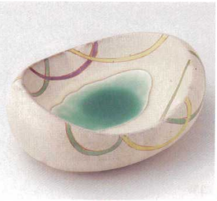
21-16-23B 3,130円 キカ紋豆型向付 40入 17.2×13.3×5.5cm