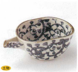
土物 21-18-22B 2,750円 片口唐草5.0鉢 30入 18.3×11×7cm