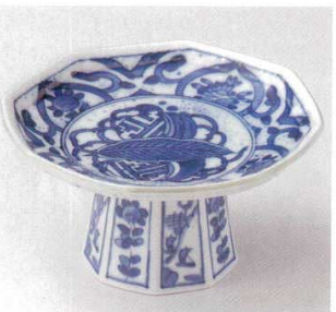
21-21-23B 3,100円 芙蓉高台向付 30入 16.8×8.3cm