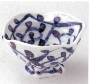
21-20-22B 2,100円 手描きタコ唐草高台向付 40入 14.3×13.5×8cm