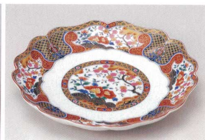
211-7-21B 3,600円 京友禅尺皿 20入 31.5×4cm