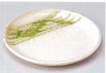
211-11-32B 2,600円 ビード口丸9.0皿 15入 27.5×2.5cm