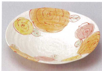
211-6-22B 3,100円 色彩フラワー8.0鉢 20入 25×5.4cm