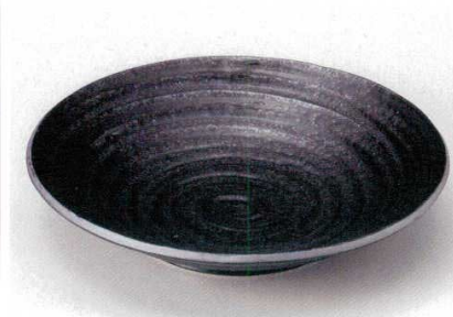
213-2-25B 1,780 円 黒水晶荒引大皿 20入 28.5×5.7cm