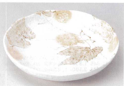
213-13-29B 1,700 円 京志野大鉢 20入 26×5.5cm