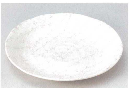
213-18-29B 980 円 京みやび8.0皿 30入 26.5cm