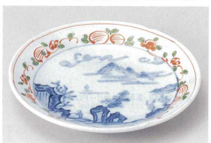
213-15-31B 870 円 赤絵山水7.0皿 40入 22.3×3.5cm