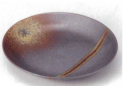
213-16-31B 930 円 南蛮吹流し7.0皿 40入 22.9cm