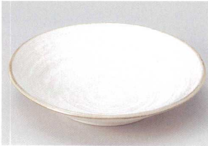
213-1-25B 1,780 円 粉引荒引大皿 20入 28.5×5.7cm