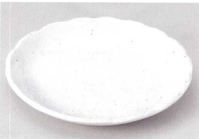
213-9-24B 1,500 円 茶寂9.7大皿 29.5×4.5cm