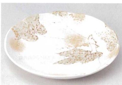
213-14-29B 900 円 京志野8.0皿 30入 25.3×3.5cm