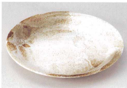
213-10-51B 1,150 円 雪志野9.0深皿 30入 28.3×4cm