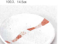
土物 221-23-45B 1,250円 粉引赤絵帯銘々皿(手造り) 100入 14.5×14×2cm