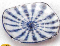
土物 221-2-74B 1,200円 御深井十草5.5皿 80入 15.5×15.3×2.5cm