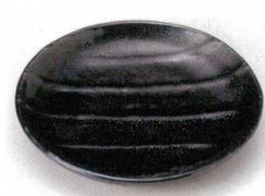
221-5-1B 1,750円 ライン油滴6.0皿 60入 18×17.5×2.8cm