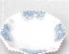
221-17-22B 1,350円 玉淵波しぶき5.5皿 60入 17.5×3.3cm