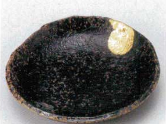
土物 南蛮金銀彩 221-15-70B 700円 4.0丸皿 150入 12.5×11.7cm 221-16-70B 1,300円 6.0丸皿 80入 17×15.5cm