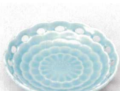
強化 221-20-22B 1,450円 深海青磁フルーツ皿 100入 15.5×3.2cm