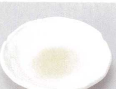
221-19-22B 1,150円 黄磁としめ5.0皿 100入 15×3.2cm