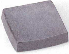
221-1-45B 1,530円 鉄ペーバスクエアプレート 小 80入 12.8×12.8×2.2cm

特選和食器 和食器準品 和食器オープン 特選洋食器 洋食器オープン 洋食器準品 中華オープン 中華食器準品 西洋食器 洋食器その他