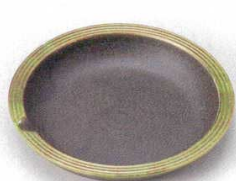
221-14-52B 1,000円 黒伊賀グリーン交趾金タタキ片口小皿 100入 13.4×2.2cm