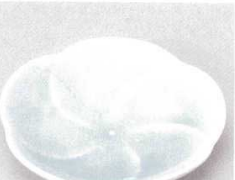
強化 221-18-70B 1,050円 青白磁梅型皿 100入 14.5cm