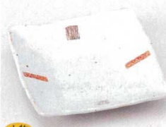
土物 221-3-45B 1,350円 赤絵四方小紋四角銘々皿(手造り) 100入 13.5×13.5×2.7cm