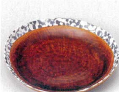
土物 221-9-61B 1,300円 アメ釉唐草和皿 60入 19×18.5×3cm