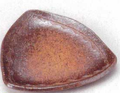
土物 221-12-45B 1,700円 灰吹三角フルーツ角皿(手造) 80入 15×14×2cm