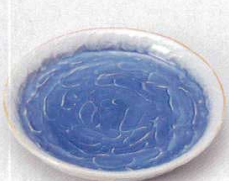
221-6-22B 1,600円 コバルト吹砂目6.0皿 30入 18.5×3cm