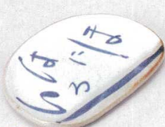
土物 221-13-33B 1,680円 いろは半月6.0皿 80入 18.5×13cm