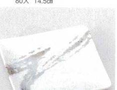
221-31-25B 1,030円 薄墨雲4.0正角皿 100入 12.4×12.4cm