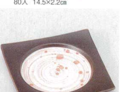
221-32-25B 1,030円 紅染15cm角皿 80入 15.3×15.3×2cm