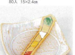
オーロラパール 221-33-21B 1,200円 四方皿(小) 80入 12×3cm 221-34-21B 1,500円 四方皿(中) 40入 15.8×4cm