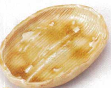
土物 221-11-45B 2,750円 灰黄瀬戸(手造り)楕円皿(小)足付 40入 19×13×3cm