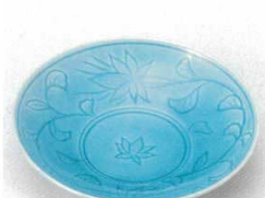
土物 221-10-21B 1,100円 トルコ唐草5.0皿 120入 15.5×3.4cm