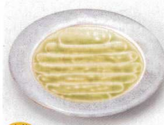
土物 221-4-14B 1,800円 ねずみ志野灰釉フルーツ皿 60入 17.4×2.3cm