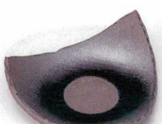
土物 221-7-1B 1,350円 ブラックストーン三角皿 40入 19.7×15.2×5.3cm