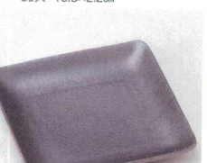
黒スワン 221-27-74B 670円 角取皿 100入 11.8×11.8×2.2cm