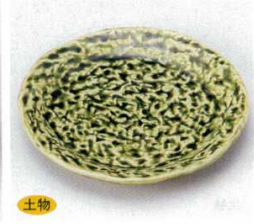
土物 224-11-5B 750円 浜織部デザート皿 100入 17.5×2.4cm