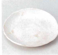
224-9-31B 810円 赤志野5.5皿 80入 17×16.7×2.2cm