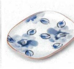
224-29-76B 580円 古染青花銘々皿 100入 16×12.5cm