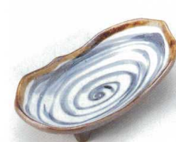
224-17-23B 950円 黒瀬三足中 60入 16×9.5×4.2cm