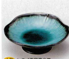
土物 ヒスイ天目高台皿 224-3-23B 640円 (小) 80入 11×4cm 224-4-23B 780円 (中) 60入 13×4.3cm