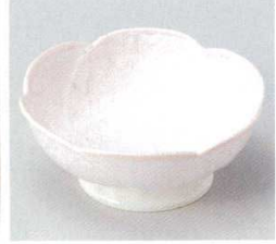
224-6-20B 800円 桜錦花型高台フルーツ皿 60入 12.8×5.2cm