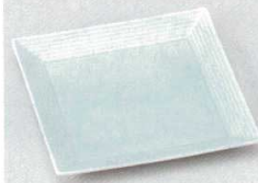
224-13-11B 800円 あさぎ千段14cm正角皿 60入 13.5×13.5×1.5cm