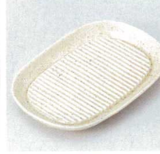
224-30-29B 460円 黄瀬戸楕円豆腐皿 80入 19×13×2.3cm