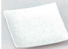
土物 224-15-75B 700円 桃山ホワイト正角銘々皿 80入 13.2×13.2×2.3cm