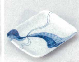
224-21-70B 670円 きよみず5.5長角皿 120入 15.7×12.5cm