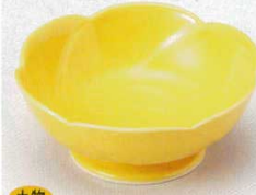
土物 224-5-20B 860円 やまぶき梅型高台 60入 12.5×5cm