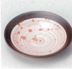
224-10-25B 750円 紅染5.0皿 80入 16.5×3.3cm