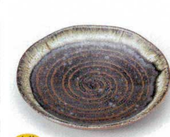
土物 224-22-1B 800円 天目流し波型5.0皿 100入 14.8×2.4cm