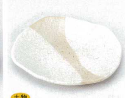
土物 224-26-23B 850円 リプルフルーツ皿 100入 17×15.5×1.8cm