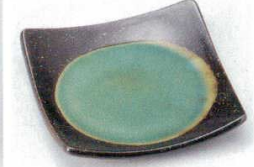
224-16-5B 630円 黒桜緑釉デザート皿 60入 15.3×15.3×2.4cm