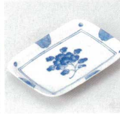
224-28-29B 410円 山茶花長角銘々皿 80入 16.8×11.3×2.3cm