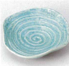
224-8-29B 940円 トルコブルーなぶり銘々皿 80入 16×14.5×3.8cm