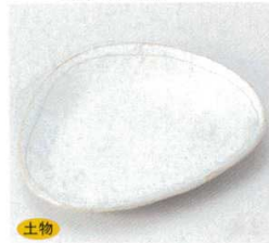
土物 224-7-23B 980円 播き落しデザート 60入 19.2×16×2.5cm