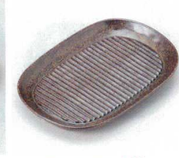
224-31-29B 460円 焦げ茶楕円豆腐皿 80入 19×13×2.3cm