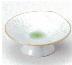
224-1-24B 980円 測彫高台皿 60入 14×5.8cm