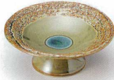
224-2-24B 950円 若草刻印高台皿 14.2×5.2cm