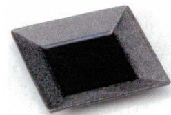
224-12-5B 780円 銀彩藍釉角デザート皿 60入 16.2×16.2×2.3cm