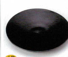
土物 224-24-70B 700円 黒陶5.0丸皿 80入 16.3cm