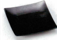
土物 224-14-70B 700円 黒陶正角小皿 100入 13.8×13.8cm