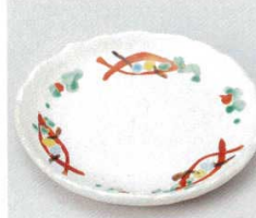
224-23-21B 860円 若鮎ちぎり4.5丸皿 120入 14.3×2cm