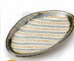
土物 224-19-14B 750円 織部二色十草取皿 100入 17×10.6×2.1cm