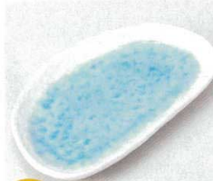
土物 224-18-70B 380円 白流水半月皿(小) 120入 18.5×10.5×2cm