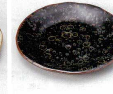
土物 228-24-1B 580円 油滴天目銘々皿 100入 13cm