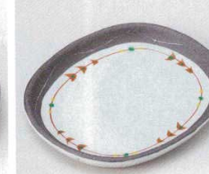
土物 228-9-74B 1,100円 潮黒赤絵小判取皿 90入 15.8×13.5cm