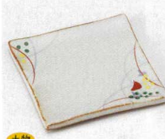
土物 228-11-1B 1,050円 京華正角銘々皿 80入 10.5×10.5cm