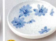
土物 228-5-61B 1,300円 デイジーブルー5寸皿 100入 14.5×3cm