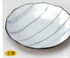
土物 228-26-61B 700円 粉引深流銘々皿 60入 14.5×2.2cm