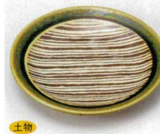
土物 228-21-70B 700円 織部すだれ紋丸銘々皿 150入 12.4cm