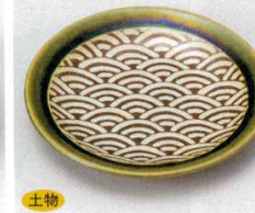
土物 228-22-70B 700円 織部波紋丸銘々皿 150入 12.4cm