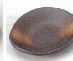
土物 228-14-45B 930円 備前風マルチデザート皿 80入 15.5×12.8×8.3cm