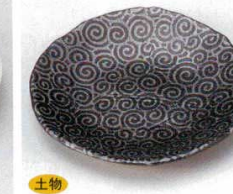
土物 228-19-1B 720円 天目唐草5.0皿 80入 15.2×2.5cm