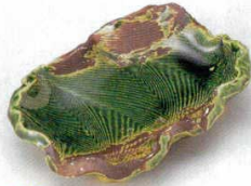
土物 228-1-20B 3,000円 織部波紋(手造り)銘々皿 40入 15×11×3.5cm