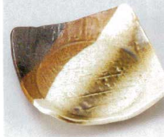
土物 228-16-25B 950円 京織部四方皿(中) 60入 15.5×15.5cm