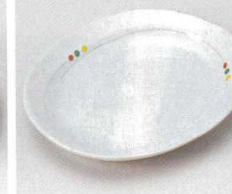
土物 228-18-45B 930円 点紋夕月皿5.0 50入 18×14.5×2.5cm