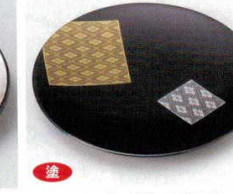
塗 228-29-27B 2,000円 色紙5寸 古代銘々皿 φ15×1.2cm[木質]