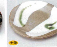
土物 228-25-1B 700円 かいらぎ織部流銘々皿 80入 13.5cm