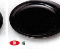
塗 溜 228-30-27B 1,750円 5.5寸 美月皿 φ16.5×2cm[M] 228-31-27B 2,050円 6.5寸 美月皿 φ19.5×2cm[M]