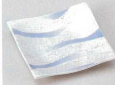
土物 228-2-52B 1,580円 流水ラスターブルー正角皿(小) 120入 11.6×11.6×2cm