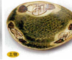
土物 228-27-74B 750円 織部積銘々皿 80入 14.7×14.5×1.5cm