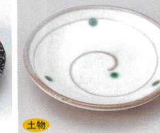
土物 228-20-11B 750円 粉引すだれ紋三ツ足銘々皿 60入 13.8×2.8cm