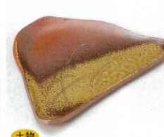
土物 228-12-45B 1,080円 あけぼの三角銘々皿(手造り) 17×12.5×15cm