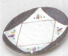
土物 228-6-74B 1,200円 黒釉いろどり6.0小判皿 80入 18×13.5cm