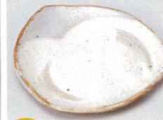
土物 228-3-45B 1,280円 粉引刷毛目三角皿 手造り 80入 14.4×14.5cm