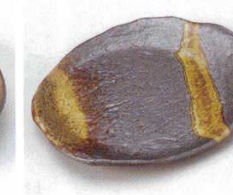
土物 228-15-43B 550円 吹き流し一服皿 80入 16×13×2cm