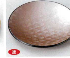
塗 228-28-27B 2,000円 内銀地4.5寸青海波皿 φ13.7×1.7cm[A]