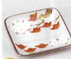
土物 228-7-45B 1,250円 雲錦銘々皿 100入 13.5×2cm