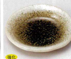
強化 228-17-73B 1,080円 織部かすみ布目4.5丸皿 100入 14×2cm