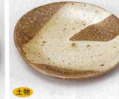
土物 228-23-1B 700円 茶かいらぎ銘々皿 80入 13.5cm