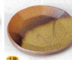
土物 228-13-45B 940円 あけぼの八角銘々皿(手造り) 80入 13×13×1.5cm