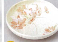
土物 228-4-61B 1,300円 デイジーオレンジ5寸皿 100入 14.5×3cm