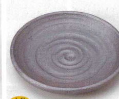
土物 228-8-45B 1,500円 黒砂焼フルーツ皿 80入 16.6×2.9cm