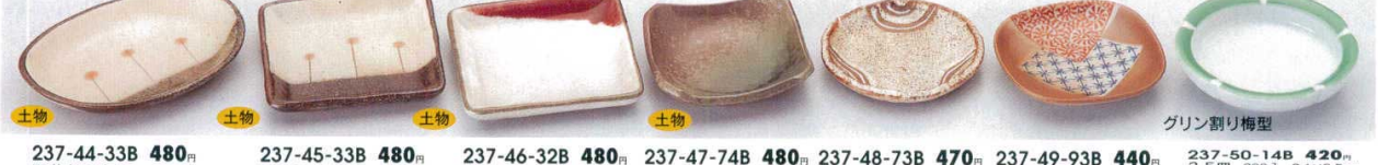
237-44-33B 480円 野花だ円小皿 180入 12.2×9.5cm 237-45-33B 480円 野花角小皿 120入 9.5×9.5cm 237-46-32B 480円 赤辰砂正角小皿 120入 9.5×9.5×1.2cm 237-47-74B 480円 南蛮織部3.0正角皿 200入 8.7×2.4cm 237-48-73B 470円 粉引木目丸小皿 200入 8.8×1.5cm 237-49-93B 440円 地紋唐草四角姫小皿 10入 8.7×8.7×1.8cm 237-50-14B 420円 2.5皿 300入 8.1×2.5cm 237-51-14B 470円 3.0皿 200入 9.6×2.5cm