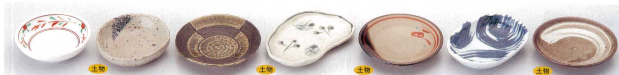
237-1-11B 580円 赤絵3.0皿 300入 9.5×2.8cm 237-2-20B 580円 友禅(手造り)小皿 80入 9.2×2.3cm 237-3-51B 570円 織部市松3.0皿 200入 10.7×2.2cm 237-4-33B 560円 芽ばえ楕円小皿 100入 12.8×8.5×1.7cm 237-5-1B 550円 花唐津丸3.0皿 200入 10.3cm 237-6-51B 550円 海流玉淵4.0小判皿 150入 11.7×8.6×2.5cm 237-7-45B 550円 内外白刷毛目3.0小皿 150入 10.3×2cm