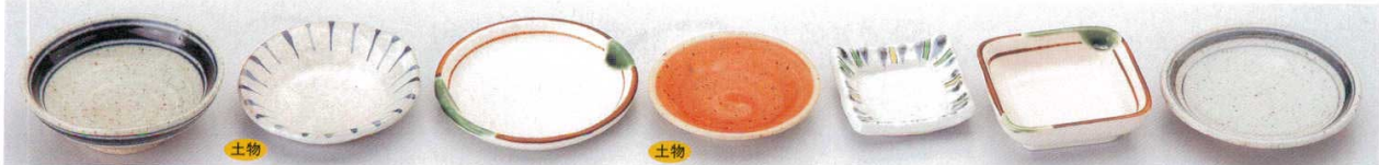
237-30-70B 500円 石焼ライン3.3浅鉢 180入 10×3.4cm 237-31-74B 500円 二色十草3.0丸皿 200入 9.3×2cm 237-32-70B 500円 織部掛筋3.5丸皿 200入 10.5cm 237-33-32B 500円 朱巻罎3.0皿 200入 9.3×1.8cm 237-34-1B 500円 赤絵ゴス十草角小皿 200入 6.8×6.8×1.5cm 237-35-70B 500円 織部掛筋豆千代口 200入 8×2.7cm 237-36-70B 500円 石焼ライン3.3丸皿 200入 10.5×2cm