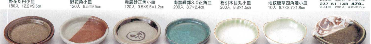
237-52-14B 470円 新唐津丸3.0皿 300入 9.5×2.3cm 237-53-14B 470円 南蛮又り分3.0皿 200入 9.5×2.5cm 237-54-14B 470円 味3.0皿 200入 9.3×2.5cm 237-55-32B 470円 ブルーグリーン3.0皿 160入 8.8×1.5cm 237-56-45B 460円 ヒワ吹測金菊形皿(中) 10×8入 8.3×2.5cm 237-57-45B 460円 ヒワ吹測金梅形皿(中) 10×8入 8.5×2.5cm 237-58-74B 460円 織部ライン丸千代久 120入 10.5×2.3cm