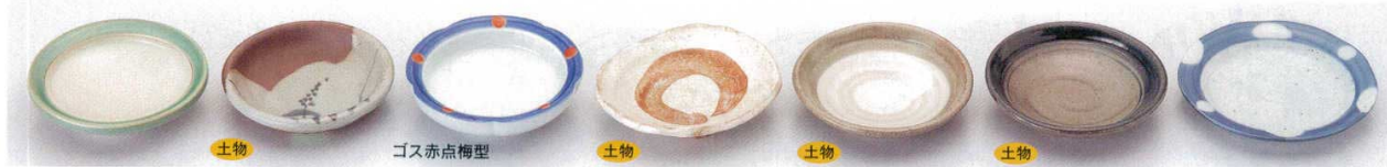
237-15-14B 520円 均窯丸3.0 300入 9.5×2.3cm 237-16-14B 520円 南蛮芦3.0皿 200入 9.3×2.5cm 237-17-14B 500円 2.5皿 300入 8×2.5cm 237-18-14B 520円 3.0皿 200入 9.5×2.6cm 237-19-23B 510円 白茶さびちぎり小皿 150入 10×8.9×2.4cm 237-20-1B 500円 粉引薬味皿 240入 9.3cm 237-21-1B 500円 手造灰軸千段小皿 150入 9.5×2.2cm 237-22-52B 500円 水玉つば付3.5皿 200入 10.5×1.5cm