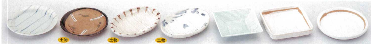
237-23-52B 500円 二色十草つば付3.5皿 200入 10.5×1.5cm 237-24-1B 500円 黒織部松葉波型3.0皿 300入 10×1.8cm 237-25-74B 500円 茶十草楕円小皿 150入 11.5×8.5×1.8cm 237-26-74B 500円 大和路楕円小皿 150入 11.5×8.5×1.8cm 237-27-11B 500円 あさぎ千段9cm正角皿 100入 9×9×2cm 237-28-70B 500円 乳白駒打切立小皿 160入 9.5×9.5cm 237-29-70B 500円 乳白駒打3.5丸皿 160入 10.5cm