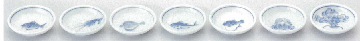
240-48-76B 230円 志野茶ライン小判小皿 200入 10.3×8.5cm 240-49-70B 230円 鉄袖ライン小判小皿 150入 10.2×8.5×1.7cm 240-50-76B 230円 志野茶ライン正角小皿 200入 8.7×8.7cm 240-51-70B 220円 鉄袖ライン正角小皿 150入 8.5×8.5×1.5cm 240-52-32B 230円 赤刷毛目玉淵3.0皿 300入 9.5×2cm 240-53-24B 230円 伊賀3寸皿 9.8cm 240-54-52B 210円 2.5皿 300入 7.8×2.5cm 240-55-52B 230円 3.0皿 300入 9×2.7cm