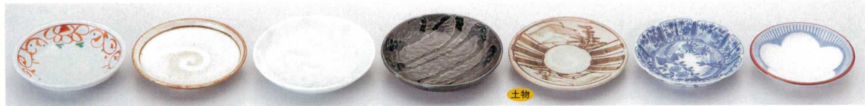
240-1-31B 310円 菊唐草3.0皿 200入 9.6×2.3cm 240-2-31B 280円 唐津白刷毛目3.0皿 200入 9.7cm 240-3-31B 280円 青白磁サギ草小皿 220入 11×2.3cm 240-4-32B 270円 黒織部流3.0皿 240入 11×2.1cm 240-5-52B 270円 雪山水玉淵3.5皿 200入 10.8cm 240-6-32B 270円 雪輪型花鳥3.0皿 200入 9.7×2cm 240-7-32B 270円 梅トクサ淵赤2.8皿 300入 9×2.2cm