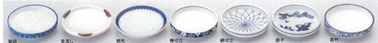
240-17-14B 280円 菊結 2.5皿 300入 7.8cm 240-18-14B 330円 240-19-14B 200円 金流し 2.5皿 300入 7.9cm 240-20-14B 250円 240-21-21B 230円 刻先 2.5皿 300入 7.5×2cm 240-22-21B 250円 小皿小 8.9×1.7cm 240-23-14B 230円 240-24-14B 240円 梅切立 2.5皿 200入 7.8cm 240-25-14B 230円 240-26-14B 240円 網切立 2.5皿 300入 7.8cm 240-27-14B 230円 240-28-14B 240円 唐子 2.5皿 300入 7.8cm 240-29-14B 230円 240-30-14B 240円 若竹 2.5皿 300入 7.8cm 240-30-14B 240円 3.0皿 300入 9.5cm