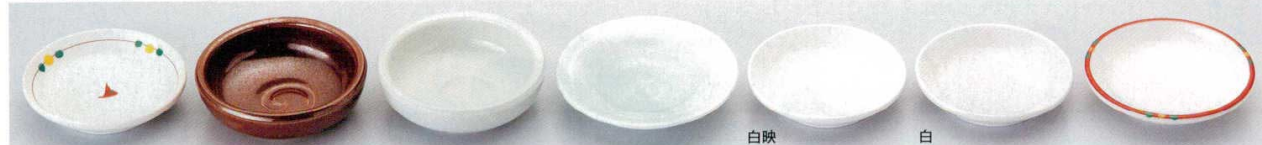
240-8-31B 270円 二色水玉3.0皿 200入 9.2×2cm 240-9-1B 270円 茶小皿 160入 10×3.1cm 240-10-1B 270円 貫入小皿 160入 10×3.1cm 240-11-32B 260円 みずも3.0皿 300入 10.6×2.3cm 240-12-25B 180円 2.8玉淵皿(マット) 240入 9.2cm 240-13-25B 190円 3.3玉淵皿(マット) 200入 10.6cm 240-14-25B 180円 2.8玉淵皿 240入 9.1×2cm 240-15-25B 190円 3.3玉淵皿 200入 10.4×2.1cm 240-16-32B 240円 新珠玉淵3.0皿 300入 9.5×2cm