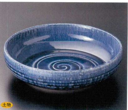
243-7-45B 14,000 円 紺青 手造尺大鉢 5入 32.5×8cm