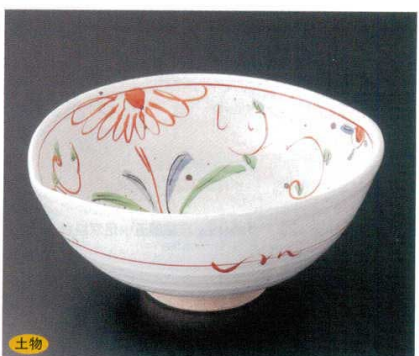
243-6-20B 10,000 円 赤絵立花船型盛鉢 15入 24×22×10cm