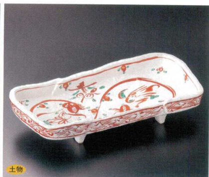
243-3-22B 9,500 円 粉引赤絵長角尺二盛皿 10入 38×16.5×8cm