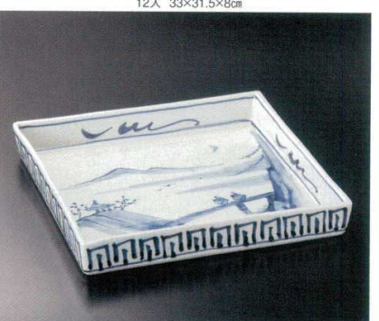
243-13-45B 12,500 円 山水四方角盛鉢 10入 31×31×4.5cm