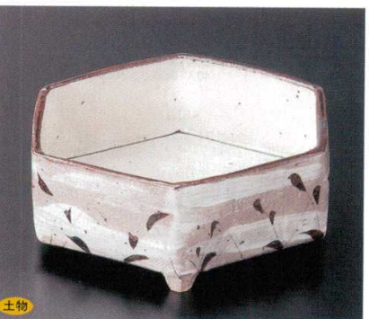
243-11-52B 11,000 円 (手造り)刷毛目流し草紋六角鉢 12入 22×19×7cm