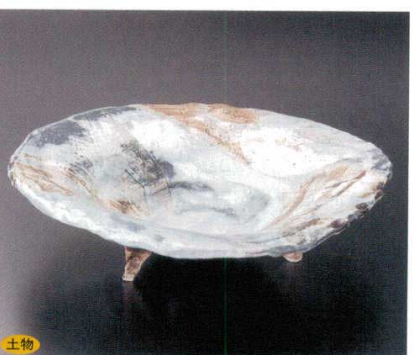
243-12-43B 12,500 円 水墨彩三つ足大鉢 5入 34.5×10.5cm