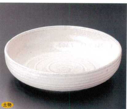
243-8-45B 14,000 円 白萩 手造尺大鉢 5入 32.5×8cm