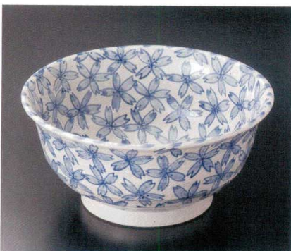
243-5-52B 11,480 円 さくら9.5高台大鉢 6入 29×13cm