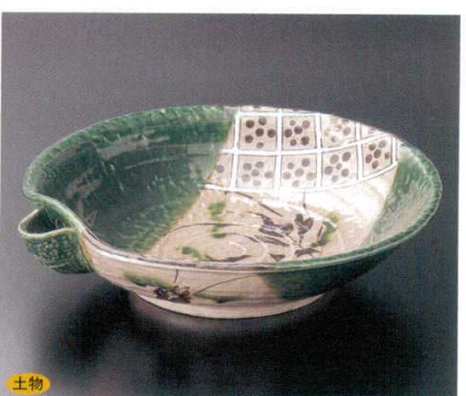
243-9-22B 7,500 円 片口織部格子9.0盛鉢 16入 26.7×25×6.5cm