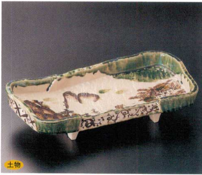
243-1-23B 11,750 円 長角織部流し山水盛皿 8入 38.5×18×8cm