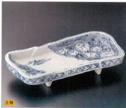
243-2-22B 10,000 円 染付山水盛鉢 10入 38×16.5×8cm