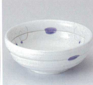
262-3-23B 1,280円 ボルドー-5.0サラダボール 40入 16×6.3cm