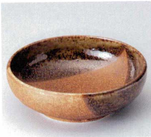
262-1-23B 700円 美濃伊賀5.5ボール 40入 17×6cm