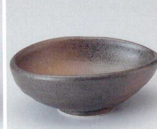
古代釉れいめいたまご