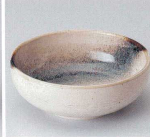
262-4-25B 700円 銀河石目5.5ボール 40入 17×6cm