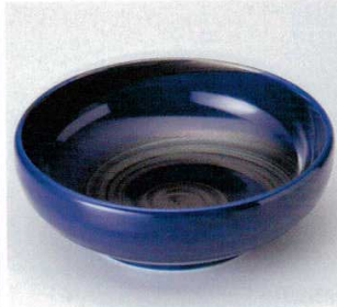
262-2-25B 800円 銀彩ブルー-5.5ボール 48入 17×5.7cm