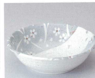
262-35-32B 800円 志野友禅7.0丼 70入 21×6cm