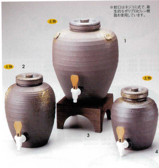
264-1-52B 38,000円 黒伊賀和つぼ(大) 1入 30×34cm 13000cc 264-2-52B 22,000円 黒伊賀和つぼ(中) 1入 21×29cm 5950cc 264-3-52B 4,800円 杉焼台(小)(中)用 20.5×20.5×12cm 264-4-52B 20,000円 黒伊賀和つぼ(小) 1入 19.3×23cm 3800cc