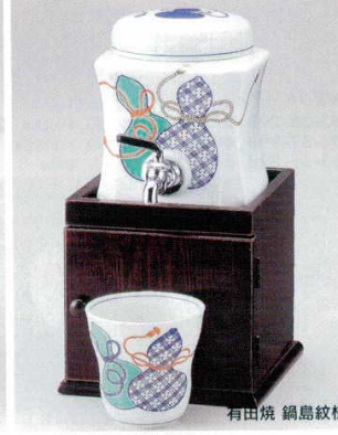
264-22-93B 11,000円 マルチサーバー 1入 1200cc 264-23-93B 1,100円 焼酎カップ 1入 9.5×9.5cm