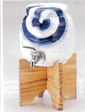
264-14-93B 6,600円 有田焼 刷毛渦(木台付)マルチサーバー 1入 1450cc