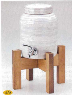
264-12-29B 6,500円 粉引焼酎サーバー 8入 15×20.5cm 2200cc 264-13-29B 1,100円 サーバー木台