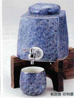
264-18-93B 17,000円 マルチサーバー 1入 2300cc 264-19-93B 1,300円 焼酎カップ 1入 8×9cm