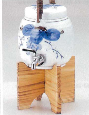
264-15-93B 7,700円 有田焼 手描ぶどう手付(台付)マルチサーバー 1入 1450cc