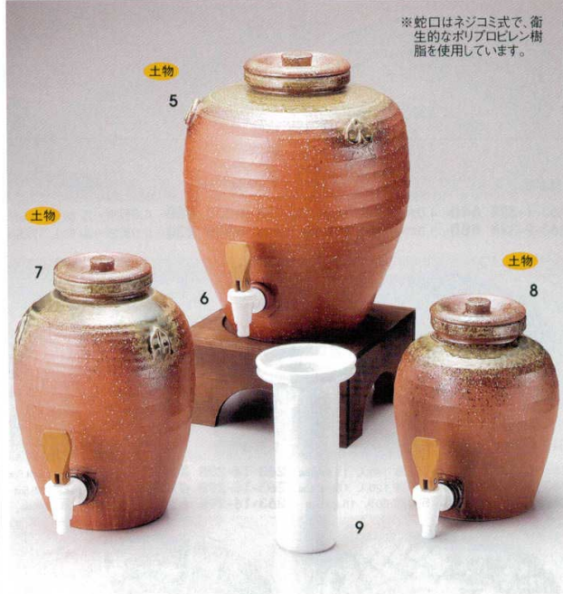
264-5-52B 38,000円 赤伊賀和つぼ(大) 1入 30×34cm 13000cc 264-6-52B 6,500円 杉焼台(大)用 24×24×12cm 264-7-52B 22,000円 赤伊賀和つぼ(中) 1入 21×29cm 5950cc 264-8-52B 20,000円 赤伊賀和つぼ(小) 1入 19.3×23cm 3800cc 264-9-52B 1,500円 陶製(白)アイスベル 1800cc