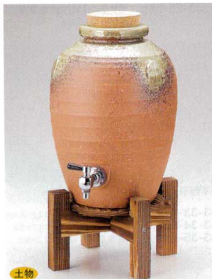
264-10-11B 18,000円 伊賀ビードロツボ形3并焼酎サーバー(木台別) 1入 21.5×31cm 5500cc 264-11-11B 3,800円 サーバー木台(小) 10入 18×13cm