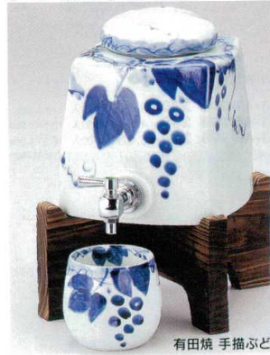
264-16-93B 17,000円 マルチサーバー 1入 2300cc 264-17-93B 1,300円 焼酎カップ 1入 8×9cm