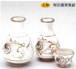
土物 粉引唐草魚紋

269-16-14B 1,680円 2号 10×8入 300cc 269-17-14B 1,000円 1号 20×6入 160cc 269-18-14B 380円 タル型ぐい呑 350入 4.5×4.7cm 269-19-14B 380円 京型ぐい呑 500入 3.9×3.8cm