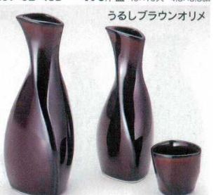
うるしブラウンオリメ

269-59-45B 1,480円 大徳利 10×8入 260cc 269-60-45B 800円 小徳利 30×4入 160cc 269-61-45B 890円 ワイン 30×10入 5.7×6.7cm 269-62-45B 490円 盃 40×10入 4.8×3.7cm