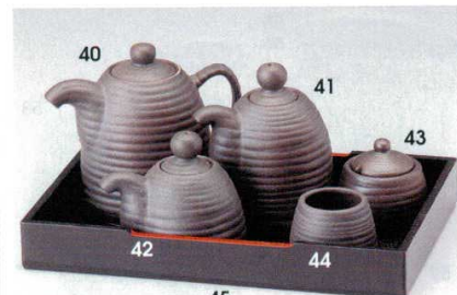
輸入品 千段黒備前