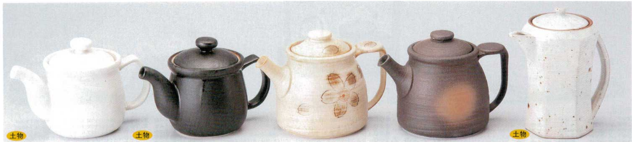
298-1-24B 2,000 円 白マット汁次 40入 480cc 298-2-24B 2,000 円 黒マット汁次 40入 480cc 298-3-43B 2,000 円 萩桜かくはん汁次(大) 2×10入 650cc 298-4-43B 2,000 円 備前かくはん汁次(大) 2×10入 650cc 298-5-45B 3,200 円 粉引青磁六角焼耐冷汁差 30入 9.3×13.8×15.6cm 430cc