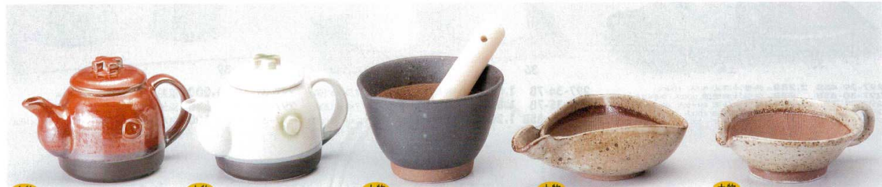
298-11-20B 1,100 円 赤釉タレポット(小) 5×10入 320cc 298-12-20B 1,100 円 白唐津タレポット(小) 5×10入 320cc 298-13-32B 940 円 黒マット麦とろ鉢 40入 13×8cm 298-14-32B 330 円 13cmスリ棒 13cm 298-15-32B 1,680 円 唐津三角片口スリ鉢小鉢 40入 14×11.2×5cm 298-16-45B 970 円 唐津すり鉢手付きドレッシング鉢 80入 15×11.8×5cm