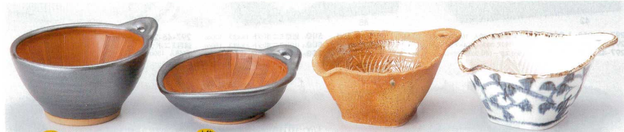
298-17-74B 1,240 円 黒釉納豆すり鉢 60入 15×13×6.8cm 298-18-74B 790 円 黒釉三角すり鉢 60入 14.5×12.8×3.8cm 298-19-23B 1,200 円 南蛮吹水玉まぜまぜ鉢 80入 15.8×12.8×6.8cm 298-20-23B 1,200 円 タコ唐草まぜまぜ鉢 80入 15.8×12.8×6.8cm