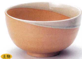
325-1-52B 2,760円 緑彩流5.0丼 30入 14.8×8.6cm