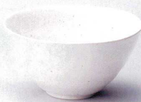
325-12-5B 920円 白サビマット多用丼 50入 15.9×8.2cm