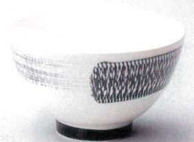
325-4-29B 1,600円 とちり5.0多用丼 40入 15.2×9cm