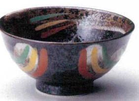
325-18-1B 850円 三彩巴5.0和丼 40入 15.8×7.8cm