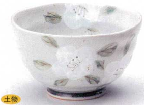
325-5-33B 1,600円 白槽5.0丼 40入 15×9cm