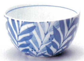
325-17-25B 630円 なごみ4.8深鉢 48入 15×8.5cm