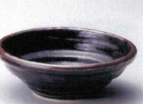
325-27-43B 900円 ゆず目輪づみ6.5寸鉢 50入 20×7cm