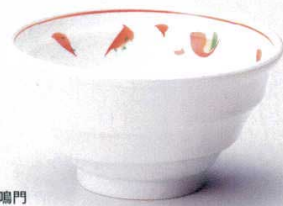
325-6-21B 1,000円 4.5高台丼 60入 13.8×7.9cm 325-7-21B 1,200円 5.0高台丼 40入 14.9×8.3cm 325-8-21B 1,300円 5.5高台丼 30入 16.2×8.7cm