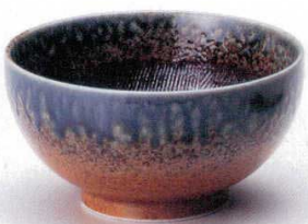
325-13-43B 800円 民芸藍流しお好み丼 40入 15.4×8cm