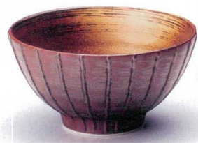
325-15-43B 680円 錆赤絹一珍5.0丼 50入 16.8×8.8cm