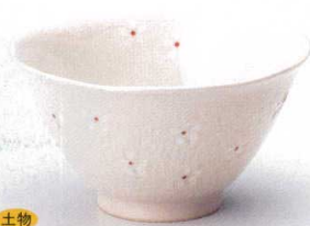
325-3-73B 1,900円 白押花5.0丼 60入 16.2×8.8cm