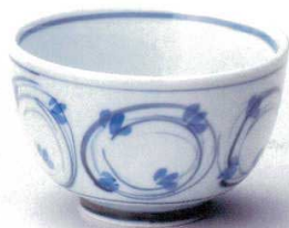
325-2-29B 2,030円 リング笹鉄火丼 30入 15×9.5cm