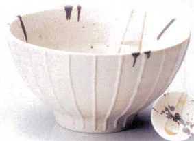
325-16-43B 680円 青嵐縞一珍5.0丼 50入 16.8×8.8cm