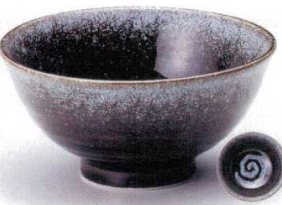
325-21-25B 460円 渦織部5.0和丼 48入 15.8×8cm