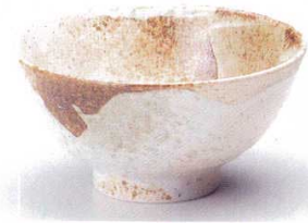
325-19-51B 480円 雪志野5.0和丼 60入 16×8cm