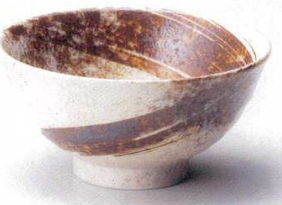
325-22-25B 460円 志野サビ刷毛5.0和丼 48入 15.8×8cm