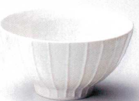
325-14-43B 700円 粉引一珍5.0丼 50入 16.8×8.8cm