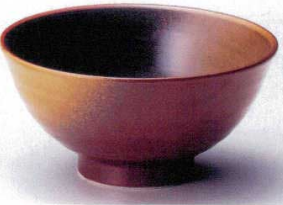
325-20-25B 460円 朱金彩5.0和丼 40入 15.8×8cm