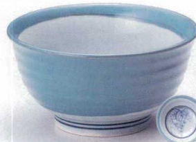
325-11-23B 1,070円 ヒスイ葡萄反種丼 50入 15.5×8cm