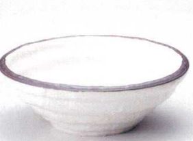
325-26-43B 900円 粉引白刷毛輪づみ6.5寸鉢 50入 20×7cm