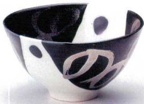
325-23-51B 2,600円 銀彩5.0丼 50入 15×8cm