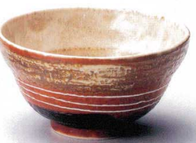
325-10-24B 1,000円 赤伊賀一珍5.0お好み丼 60入 15.7×15.7×8.1cm