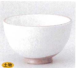
土物 331-4-1B 1,050円 粉引多用碗 60入 12.3×7.5cm