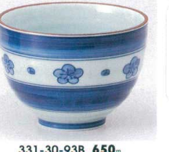
331-30-93B 650円 有田焼 青巻梅お好み碗 5入 12×9cm