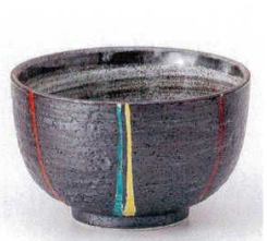
331-2-20B 1,380円 黒マット色十草4.0深ボール 60入 12×7.3cm