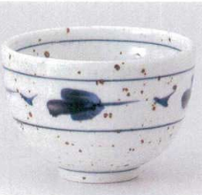
331-8-33B 840円 梨地つた絵小井 60入 12×8.5cm