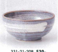
331-21-20B 530円 均楽粉引4.0京井 80入 12.7×6cm