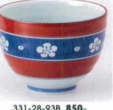
331-28-93B 850円 有田焼 赤巻梅お好み碗 5×16入 12×9cm