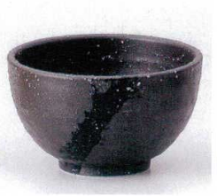
331-12-23B 630円 石目曇星4.0井 80入 12.5×7.2cm