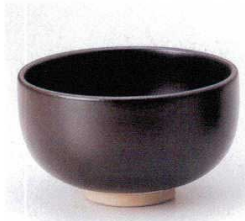
331-1-33B 1,400円 鉄釉お粥碗 60入 12×7.2cm