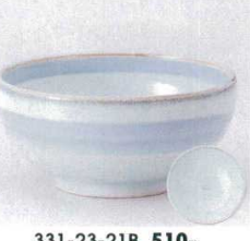
331-23-21B 510円 グレー巻4.0京井 80入 12.7×5.8cm