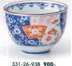
331-26-93B 900円 有田焼 染錦扇花一膳井 3入 12.2×8.8cm