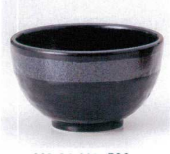
331-16-33B 500円 銀彩黒石目4.0井 50入 12.3×7.3cm