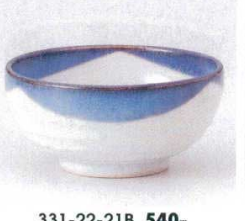
331-22-21B 540円 ウノフ4.0京井 80入 12.6×6cm