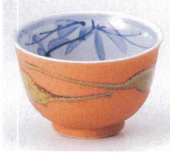
331-11-52B 680円 赤伊賀内菊4.5多用井 40入 12.2×7.9cm