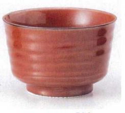
331-17-43B 500円 鉄赤茶清碗 80入 12.3×8cm