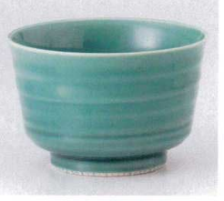
331-19-43B 500円 織部茶清碗 80入 12.3×8cm