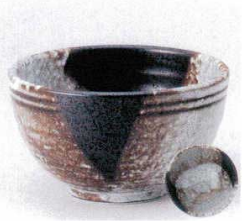
331-14-51B 550円 白鹿の子石目4.0井 60入 12.5×7.3cm