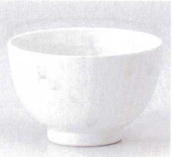
331-7-51B 820円 スプリング夏目3.8井 60入 12×7.7cm