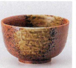
331-10-22B 700円 信楽オリベ吹4.0深ボール 80入 12×7cm