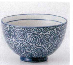
331-5-1B 1,050円 タコ唐草多用碗 60入 12.3×7.5cm