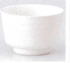
331-20-43B 500円 粉引茶清碗 80入 12.3×8cm