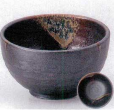
331-13-31B 550円 雨竜吹流し石目4.0井 60入 12.2×7.1cm