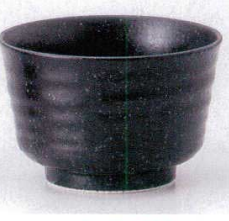
331-18-43B 500円 黒天目茶清碗 80入 12.3×8.0cm