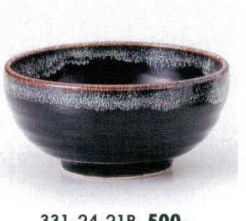
331-24-21B 500円 天目白流4.0京井 80入 12.7×5.8cm