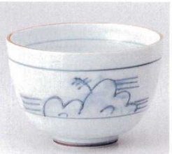
331-9-23B 730円 山水4.0多用碗 30入 12.2×8.4cm