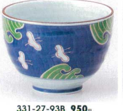
331-27-93B 950円 有田焼 波千鳥お好み碗 5入 12×9cm