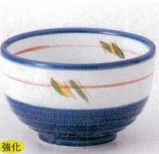
強化 331-3-22B 1,260円 たんざく紋4.0夏目井 50入 12×7.2cm