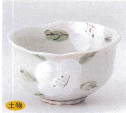
土物 331-6-33B 930円 白槽菱形4.0小鉢 60入 12.5×7cm