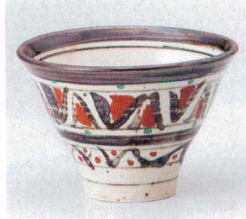
334-10-52B 1,380円 赤絵古代紋4.0反丼 60入 12.2×8cm