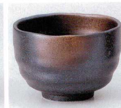
334-29-31B 460円 備前風金茶吹京小丼 60入 10.8×7.2cm