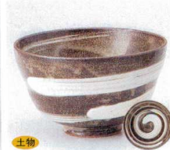
土物 334-20-31B 1,100円 南蛮渦小丼 60入 12.7×7.8cm