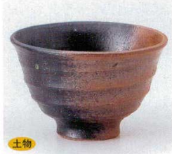
土物 334-11-52B 1,240円 備前黒吹反4.0丼 60入 12×7.5cm