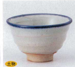
土物 334-14-52B 1,200円 測コス巻反4.0小鉢 60入 12.2×7.6cm