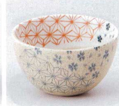
334-32-29B 370円 つむぎ多用碗 40入 12×7cm