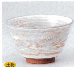
土物 334-7-45B 1,500円 竹目反り飯器 60入 12.3×7cm