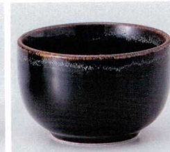
334-30-21B 400円 天目白流4.0飯器 60入 11×7cm