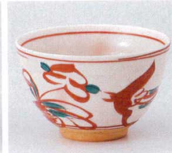
334-19-31B 1,100円 桜釉赤絵花鳥一膳丼 60入 12.2×7.7cm