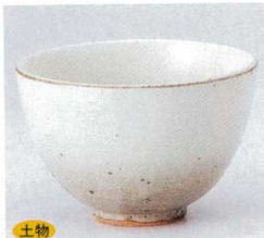
土物 334-1-52B 3,000円 唐津化粧多用鉢 80入 11.7×7.6cm