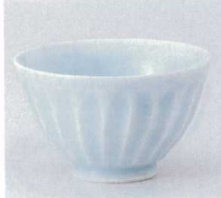
334-3-1B 1,950円 青磁毛ぎ深鉢(小) 60入 11.5×7cm 334-4-1B 2,000円 青磁毛ぎ深鉢(大) 48入 13×7.8cm