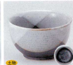
土物 334-18-74B 1,100円 志野塗分多用丼 50入 12.6×7.5cm