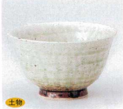
土物 334-5-1B 1,600円 やわらぎ反茶漬碗 60入 13.2×8cm