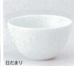
日だまり 334-26-11B 600円 11cmシンブルボール 100入 11×6.3cm 334-27-11B 700円 12cmシンブルボール 80入 12×6.9cm