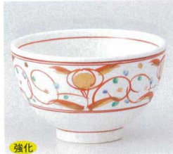
強化 334-2-74B 2,900円 赤絵華紋4.0丼 50入 12.4×7.7cm