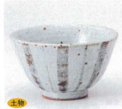
土物 334-15-52B 1,150円 サビ十草丸反4.0丼 60入 13.1×7.5cm