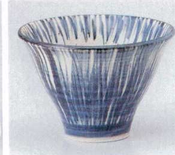
334-25-33B 840円 紺刷毛4.0反丼 80入 12×8.5cm