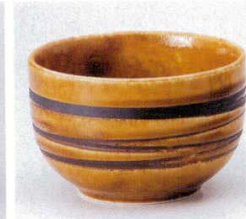
334-31-52B 400円 いらほ結晶お好碗 60入 11×7cm