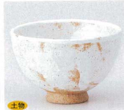
土物 334-8-74B 1,470円 白志野多用丼 60入 12.5×8cm