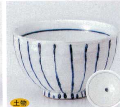
土物 334-24-33B 1,050円 粉引須十草茶漬碗 60入 12.5×7.5cm