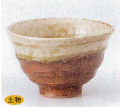
土物 334-6-52B 1,520円 美濃伊賀反4.0小鉢 60入 12.2×7.6cm