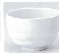
334-28-31B 460円 淡雪京小丼 60入 10.8×7.2cm