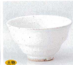
土物 334-13-52B 1,250円 本粉引お茶漬け碗 60入 13×7.5cm