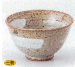
土物 334-16-52B 1,150円 一本白刷毛丸反4.0丼 60入 12.8×7.5cm