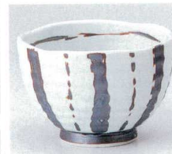
334-22-24B 1,000円 サビ十草4.0多様丼 60入 12×8cm