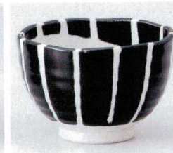
334-23-24B 1,000円 黒太十草4.0多様丼 60入 12×8cm