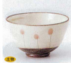
土物 334-21-33B 1,100円 野花小丼 60入 12.7×7.8cm