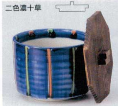
338-13-31B 1,970円 段蓋付飯器 50入 12cm(蓋) 338-14-31B 1,570円 草飯器(身) 50入 10.7×8.1cm