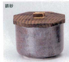
338-41-20B 1,300円 飯器(焼杉蓋付) 30入 11×8cm 338-42-20B 1,000円 飯器(身) 40入 11×8cm