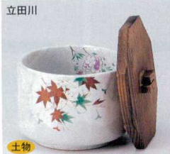
土物 338-15-23B 1,730円 飯器 30入 10.5×7.8cm 338-16-23B 1,500円 飯器(身) 30入 10.5×7.8cm