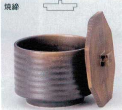
338-17-74B 1,900円 段蓋付飯器(小) 40入 10.5×9.5cm 338-18-74B 1,420円 飯器(身) 40入 10.5×7.8cm