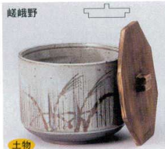
土物 338-1-52B 1,900円 飯器(蓋付) 30入 11.5×11.5cm 338-2-52B 1,530円 飯器(身) 40入 11.5×9.3cm