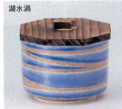
338-45-20B 1,300円 蓋付飯器 40入 11×12cm 338-46-20B 1,000円 飯器(身) 40入 11×12cm