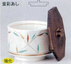
強化 338-7-74B 2,750円 飯器(小) 40入 10.5×9.5cm 338-8-74B 2,270円 飯器(小) 40入 10.5×7.5cm