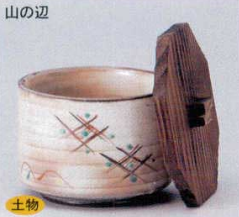
土物 338-9-1B 2,250円 蓋付飯器 36入 12.5×9.7cm 338-10-1B 2,000円 飯器(身) 36入 10.6×7.7cm