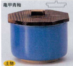
土物 338-25-31B 1,300円 段蓋付飯器 40入 蓋12cm 338-26-31B 920円 飯器(身) 50入 10.6×7.7cm