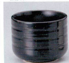
338-51-24B 950円 天目飯器 40入 11.2×11.2×9.1cm