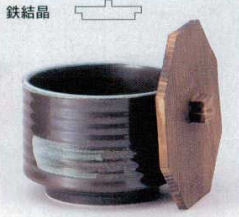
338-19-74B 1,900円 段蓋付飯器(小) 40入 10.7×9.5cm 338-20-74B 1,420円 飯器(身) 40入 10.7×8cm