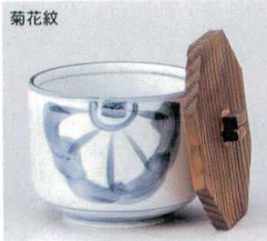
338-3-32B 1,400円 飯器 11×10cm 338-4-32B 1,100円 飯器(身) 11×8.7cm