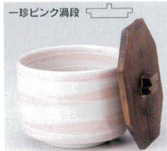
338-11-31B 1,970円 段蓋付飯器 50入 12cm(蓋) 338-12-31B 1,570円 飯器(身) 50入 10.7×8.1cm