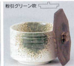
338-52-31B 1,380円 段蓋付飯器 40入 蓋12cm 338-53-31B 980円 飯器(身) 40入 10.5×7.6cm