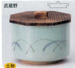
土物 338-23-31B 1,300円 段蓋付飯器 40入 蓋12×12cm 338-24-31B 920円 飯器(身) 50入 10.6×7.7cm