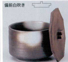
338-54-31B 1,380円 段蓋付飯器 40入 蓋12cm 338-55-31B 980円 飯器(身) 40入 10.5×7.6cm