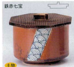
土物 338-21-31B 1,300円 段蓋付飯器 50入 12cm 338-22-31B 920円 飯器(身) 50入 10.6×7.7cm