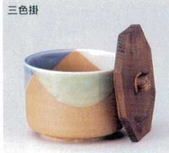
338-49-20B 1,300円 飯器蓋付 30入 11×10cm 338-50-20B 1,000円 飯器(身) 40入 11×8cm