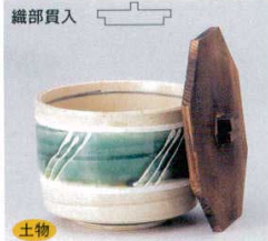
土物 338-27-52B 1,620円 飯器(木蓋付) 30入 10.5×10cm 338-28-52B 1,200円 飯器(身) 40入 10.5×8cm