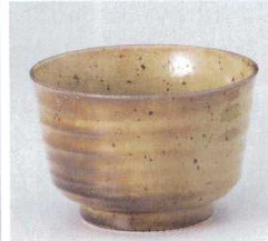
338-56-43B 500円 唐津茶漬碗 80入 12.3×8cm