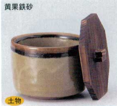
土物 338-39-33B 1,400円 蓋付飯器 30入 11×10cm 338-40-33B 1,150円 飯器(身) 30入 11×8cm