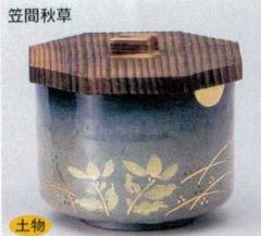
土物 338-5-11B 2,350円 飯器(身) 40入 10.5×10.4cm 338-6-11B 270円 飯器蓋のみ 40入 12cm