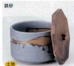
土物 338-33-23B 1,450円 飯器 30入 10.5×7.8cm 338-34-23B 1,190円 飯器(身) 30入 10.5×7.8cm