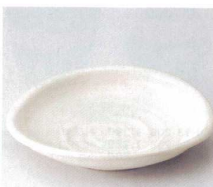
349-8-32B 1,860円 タマゴ型粉引大皿 40入 24.5×22.4×3.6cm