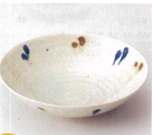
349-13-23B 1,620円 水玉7.0丸平鉢 30入 21.5×5.8cm