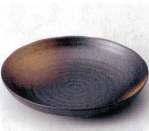
349-10-31B 800円 備前風金茶吹新バスタ皿 40入 22×3.9cm