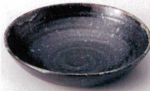
349-2-1B 3,100円 天目流し7.0ボール 24入 21.5×5cm