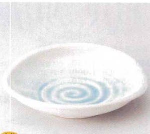
349-9-5B 2,500円 漆彩貫入ブルーたまご型8.0皿 30入 25×23×5cm