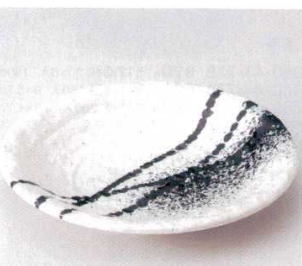
349-14-25B 1,180円 吹あそび石目7.0皿 40入 22.5cm