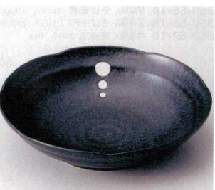
349-18-51B 430円 黒ドット6.8深皿 60入 20.5×5.2cm