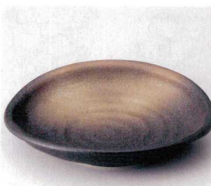
349-7-32B 1,860円 古代釉れいめいたまご大皿 36入 24.5×22.4×3.6cm