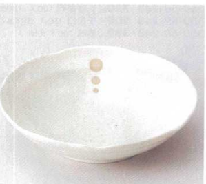
349-17-51B 430円 白ドット6.8深皿 60入 20.5×5.2cm