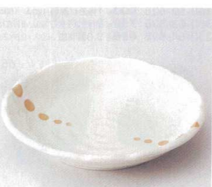
349-19-33B 450円 淡雪ドット7.0深皿 50入 22.5×4.4cm