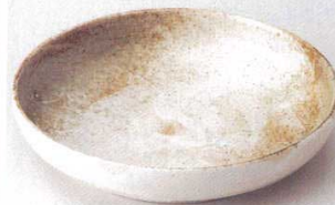
349-4-43B 900円 雪志野切立バスタ 40入 21.8×4.5cm