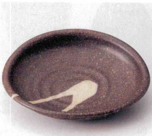
349-5-20B 1,900円 銀彩茶たまご大皿 40入 25×22.3×5cm