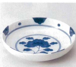
349-12-29B 650円 山茶花切立7.0皿 40入 20.3×4cm