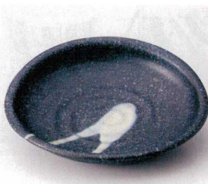
349-6-32B 1,860円 たまご型黒銀彩大皿 40入 24.5×22.4×3.6cm