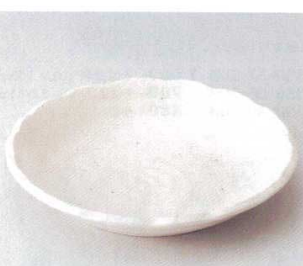
349-16-32B 390円 肌粉引六ペイ溝型7.0深皿 60入 22.5×4cm