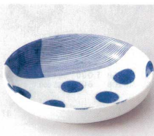
349-11-29B 650円 スダレ菊切立7.0皿 40入 20.3×4cm