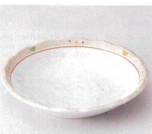
349-15-31B 680円 しなやか7.0深皿 40入 21.3×4.2cm