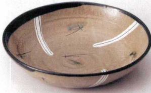
349-1-1B 3,400円 黒織部松葉そば皿 36入 21.5×4.5cm