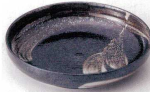
349-3-43B 900円 明世荒刷毛切立バスタ 40入 21.8×4.5cm