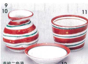
赤絵二色渦 351-9-31B 1,170円 1号そば徳利 10×8入 180cc 351-10-31B 1,300円 2号そば徳利 10×6入 6.4×10cm 300cc 351-11-31B 870円 1号そば猪口 100入 8.4×6cm 351-12-31B 500円 3.0小皿 240入 10.1cm