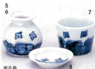
波千鳥 351-5-33B 880円 1号徳利 20×5入 180cc 351-6-33B 1,300円 2号徳利 20×4入 250cc 351-7-33B 590円 1号そば千代口 120入 8.2×6.5cm 351-8-33B 510円 薬味皿 200入 8.6cm