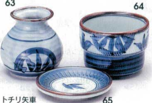
トチリ矢車 351-63-1B 900円 1号そば徳利 20×6入 7cm 200cc 351-64-1B 740円 段付そば猪口 100入 9×6.5cm 351-65-1B 480円 薬味皿 240入 9cm