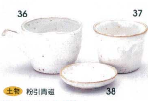
土物 粉引青磁 351-36-20B 2,100円 片口つゆ入れ 60入 200cc 351-37-20B 880円 1号そば千代口 120入 8.3×6.5cm 351-38-20B 780円 小皿 280入 8.7×1.8cm