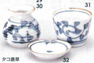
夕口唐草 351-29-23B 780円 1号そば徳利(小) 80入 5.8×8cm 200cc 351-30-23B 900円 1号そば徳利(大) 60入 7.2×5.5×10.3cm 280cc 351-31-23B 680円 1号そば千代口 80入 8.7×6.1cm 351-32-23B 470円 薬味皿 200入 9.2×2.2cm