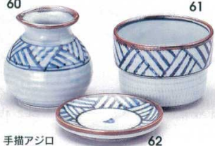
手描アジロ 351-60-1B 900円 1号そば徳利 20×6入 7cm 200cc 351-61-1B 740円 1号そば千代口 120入 9×6.5cm 351-62-1B 480円 薬味皿 200入 9cm