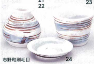
志野軸刷毛目 351-21-33B 770円 1号そば徳利 10×10入 7.5×7.5cm 200cc 351-22-33B 930円 2号そば徳利 10×8入 9.9×9.9cm 300cc 351-23-33B 670円 1号そば千代口 120入 8.5×6.5cm 351-24-33B 460円 薬味皿 300入 9cm