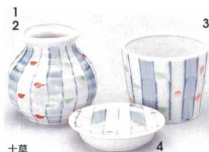
十草 351-1-22B 1,100円 1号そば徳利(小) 10×8入 約180cc 351-2-22B 1,400円 1号そば徳利(大) 10×6入 約270cc 351-3-22B 930円 1号そば千代口 80入 8.3×6.6cm 351-4-22B 680円 小皿 150入 8.5×2.2cm