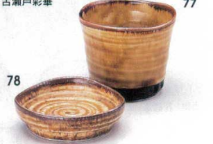
古瀬戸彩華 351-77-33B 420円 1号そば千代口 100入 8.8×7.3cm 351-78-33B 340円 切立皿 160入 9.5×2.7cm