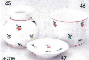
小花散 351-45-1B 1,100円 1号そば徳利 20×6入 200cc 351-46-1B 780円 1号そば千代口 100入 8×6cm 351-47-1B 600円 薬味皿 200入 8.6×1.9cm