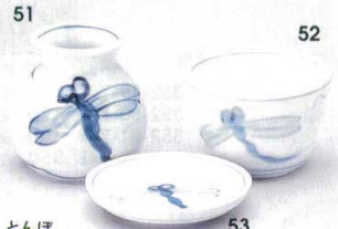
とんぼ 351-51-14B 1,100円 1号徳利 100入 7.5×7.5cm 150cc 351-52-14B 850円 1号そば猪口 100入 8.3×5.5cm 351-53-14B 400円 薬味皿 200入 9×1.4cm