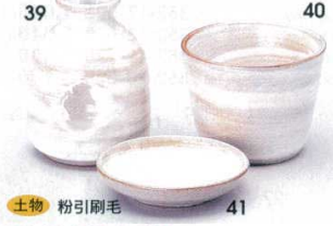
土物 粉引刷毛 351-39-20B 1,150円 1号そば徳利 100入 200cc 351-40-20B 880円 1号そば猪口 120入 8×6.5cm 351-41-20B 780円 薬味皿 280入 8.7cm