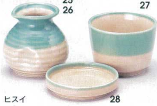
ヒスイ 351-25-31B 840円 1号そば徳利 10×8入 約200cc 351-26-31B 1,000円 2号そば徳利 10×6入 約300cc 351-27-31B 520円 1号そば猪口 100入 8.3×6.1cm 351-28-31B 380円 切立薬味皿 210入 8.7×1.8cm