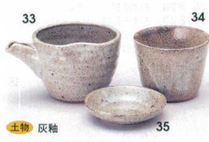
土物 灰釉 351-33-20B 2,100円 片口つゆ入れ 60入 9.5×7cm 200cc 351-34-20B 880円 1号そば千代口 120入 8.3×6.5cm 351-35-20B 800円 小皿 280入 8.7×1.8cm