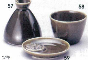
ツキ 351-57-24B 1,300円 1号そば徳利 120入 200cc 351-58-24B 650円 1号そば千代口 120入 8.5×6cm 351-59-24B 860円 オロシ小皿 200入 10.5cm