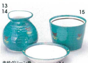
赤絵グリーン巻 351-13-31B 1,170円 1号そば徳利 10×8入 180cc 351-14-31B 1,300円 2号そば徳利 10×6入 6.4×10cm 300cc 351-15-31B 870円 1号そば猪口 100入 8.4×6cm 351-16-31B 500円 3.0小皿 240入 10.1cm