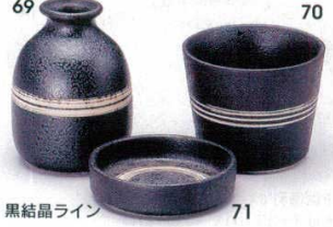
黒結晶ライン 351-69-5B 670円 1号そば徳利 10×10入 6.5×9.2cm 200cc 351-70-5B 400円 1号そば千代口 10×10入 8.3×6.6cm 351-71-5B 320円 薬味皿 200入 8.3×2.2cm