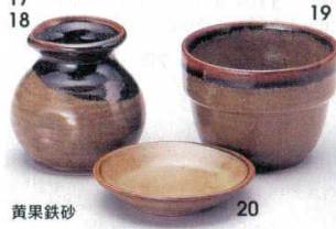
黄果鉄砂 351-17-33B 850円 1号そば徳利 20×5入 約200cc 351-18-33B 1,250円 2号そば徳利 18×5入 約200cc 351-19-33B 720円 段付そば千代口 100入 9.3×7cm 351-20-33B 420円 3.0皿 240入 9.5cm