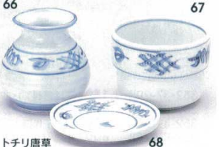
トチリ唐草 351-66-51B 880円 1号そば徳利 10×12入 180cc 351-67-51B 670円 1号そば千代口 120入 8.8×6.4cm 351-68-51B 460円 薬味皿 240入 9.4cm