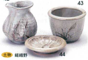
土物 嵯峨野 351-42-52B 950円 1号そば徳利 100入 200cc 351-43-52B 950円 1号そば千代口 120入 9.2×6.9cm 351-44-52B 470円 3.0皿 300入 9.5×2.2cm