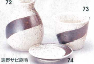
志野サビ刷毛 351-72-25B 650円 1号そば徳利 10×8入 9×11.5cm 350cc 351-73-25B 340円 1号そば千代口 120入 8.5×7cm 200cc 351-74-25B 240円 3.0薬味皿 240入 9cm