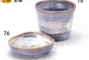
土物 彩華 351-75-32B 430円 鼠志野白ハケそば千代口 80入 8.5×7.2cm 210cc 351-76-32B 350円 三角型薬味皿 100入 9.5×2.7cm