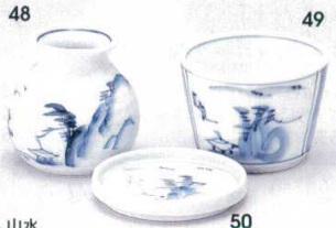
山水 351-48-14B 1,100円 1号徳利 100入 7.5×7.5cm 150cc 351-49-14B 1,000円 1号そば猪口 100入 8.5×6.4cm 351-50-14B 420円 薬味皿 200入 8.7×1.5cm