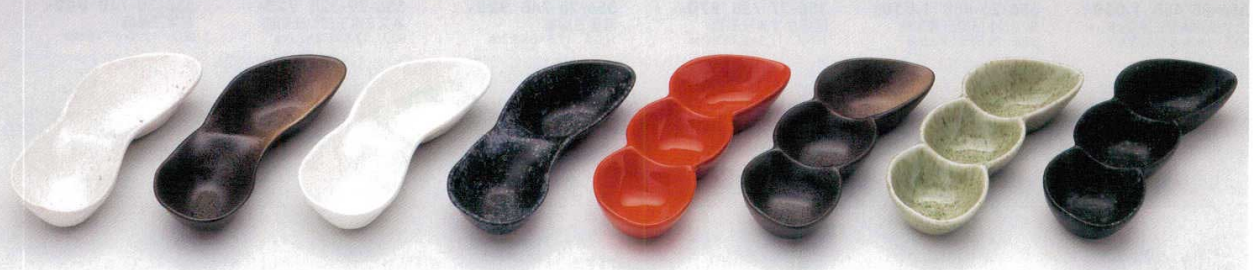
355-31-32B 640円 白釉二品皿 80入 17.5×7×3cm 355-32-32B 640円 古代釉れいめい二品薬味入 アイボリー二品皿 150入 17.7×7×3.4cm 355-33-32B 640円 アイボリー二品皿 80入 17.5×7×3cm 355-34-32B 640円 黒銀彩二品皿 80入 17.5×7×3cm 355-35-32B 1,000円 磁器朱塗三品入 120入 19×6.6×3.1cm 355-36-32B 680円 古代釉れいめい三品薬味入 120入 19×6.8×3cm 355-37-32B 680円 灰釉三品入 60入 19×7×3cm 355-38-32B 680円 銀彩黒三品薬味入 100入 19×6.8×3cm