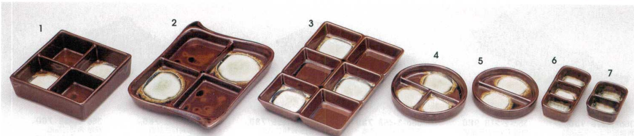
355-1-70B 1,000円 外サビオフケ4品盛 11.5×11.5cm 355-2-74B 1,180円 オフケ竹型四品盛 50入 18×14×2.3cm 355-3-73B 1,400円 サビガラス流六仕切皿 60入 18.5×12.3×2.3cm 355-4-70B 550円 オフケ丸3品盛 150入 10×2cm 355-5-70B 500円 オフケ丸2品盛 150入 9×1.7cm 355-6-74B 550円 オフケミニ三品盛 120入 9.8×4.3×2.3cm 355-7-74B 420円 オフケミニ二品盛 150入 6.2×4.3×2.2cm