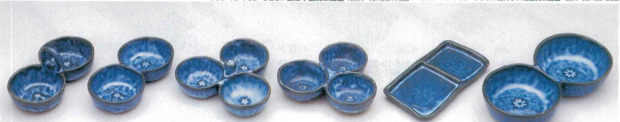
355-17-73B 980円 青三島手付二品皿 2×30入 15×7.6×2.8cm 355-18-73B 930円 青三島二品皿 4×20入 15×7.6×2.8cm 355-19-73B 980円 青三島手付三品皿 2×30入 14.2×3cm 355-20-73B 930円 青三島三品皿 2×30入 14.2×14.2×3cm 355-21-73B 450円 青三島角二品皿 100入 16×8.3×1.3cm 355-22-73B 1,170円 青三島二品皿(大) 60入 20.5×10.5×3.7cm