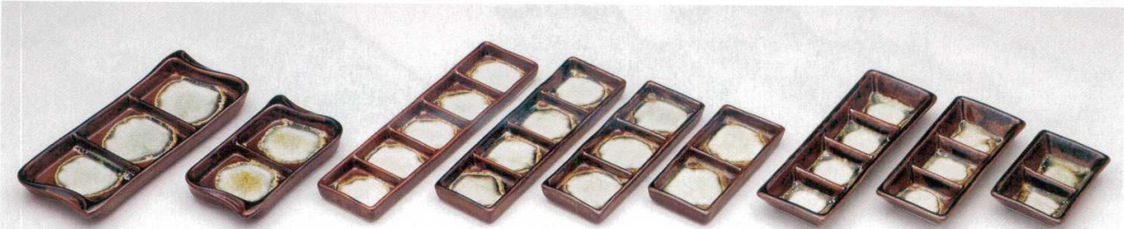
355-8-73B 790円 竹型錆ガラス流三品皿 90入 20×8.7×2.5cm 355-9-73B 580円 竹型錆ガラス流二品皿 120入 13.7×8.2×2.5cm 355-10-73B 950円 錆生子五品皿 80入 23.2×6.2×1.5cm 355-11-73B 780円 錆生子四品皿 80入 20.4×6.2×1.5cm 355-12-73B 600円 錆生子細口三品皿 80入 16.8×6.2×1.5cm 355-13-73B 520円 錆生子細口二品皿 120入 13×6.3×1.5cm 355-14-73B 860円 錆ガラス流四品皿 90入 19.5×6.5×2.5cm 355-15-73B 700円 錆ガラス流細口三品皿 100入 15×6.5×2.5cm 355-16-73B 560円 錆ガラス流細口二品皿 120入 9.8×6.3×2.5cm