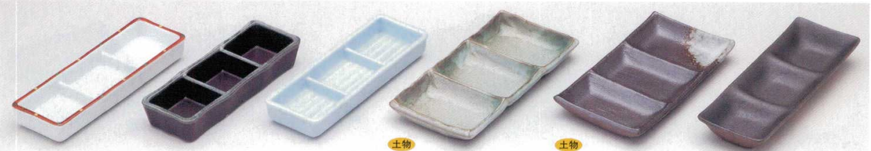
357-13-74B 880円 湖赤水玉三品盛 60入 18×6.3×2.7cm 土物 357-14-74B 850円 鉄結晶三品皿(小) 60入 17×6×2.8cm 357-15-74B 630円 青白磁三品盛 60入 18×6.3×2.7cm 土物 357-16-75B 990円 深草三品盛 60入 19.3×9.2×2.3cm 土物 357-17-75B 850円 なごり雪三品皿 60入 19.5×10×2cm 357-18-74B 760円 黒スワン三品盛 80入 20×6.8×2.7cm