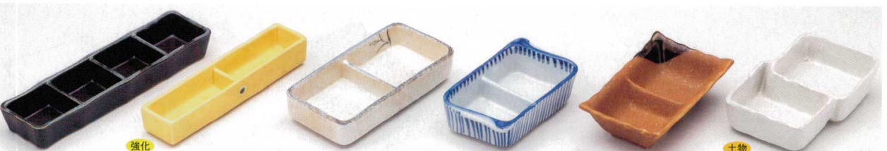
強化 357-31-74B 1,200円 鉄結晶四品皿(小) 60入 22.3×6×2.8cm 357-32-74B 960円 黄檗二品盛 80入 18.5×4×3.3cm 357-33-74B 820円 石焼芦二品 60入 16.5×8cm 357-34-74B 720円 青地十草深口二品盛 80入 13.5×8×4cm 土物 357-35-7B 700円 伊賀風深口二品皿 80入 15×8.5×4cm 357-36-43B 600円 粉引クリームちび四角 50入 14.7×9.3×3.8cm