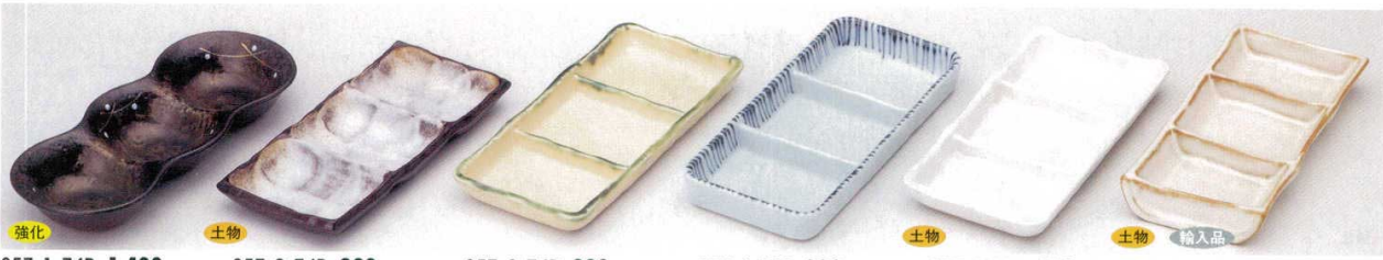
強化 357-1-74B 1,400円 金彩むさしの珍珠三品皿 60入 21.5×9×3.2cm 土物 357-2-74B 920円 備前志野三品盛 60入 19.2×9.2×2.3cm 357-3-74B 880円 黄瀬戸三品 60入 21×10cm 357-4-76B 880円 千筋十草三品皿 60入 21.3×9.5×2.5cm 土物 357-5-75B 850円 白刷毛目三品盛 60入 18.7×7.5×3cm 土物 輸入品 357-6-45B 860円 かすみ野竹節三つ仕切皿 5×6入 20.2×9×2.5cm