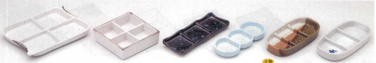
357-25-73B 1,150円 そば志野四品皿 50入 18×14.2×2.3cm 357-26-73B 1,150円 そば志野深口四品皿 60入 11.7×11.7×3.5cm 357-27-73B 1,100円 黒瀬戸三品皿 100入 17.6×6.5×2cm 357-28-74B 550円 青白磁丸三品盛 60入 15.4×6.3×2cm 土物 357-29-76B 550円 三色ヌリ分け三品皿 80入 15.8×7.8×2.5cm 357-30-70B 520円 ハケメ小花三品盛 90入 16×8×2.5cm