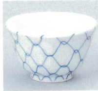
390-8-73B 500円 書網厚口反煎茶(陶勇) 180入 9.2×5.7cm