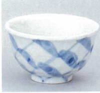
390-9-73B 500円 太網厚口反煎茶 150入 9.2×5.5cm