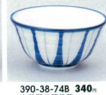
390-38-74B 340円 十草厚口反煎茶 180入 9.8×5.3cm