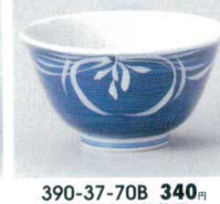
390-37-70B 340円 呉須巻らん反煎茶厚口 200入 9.8×5.5cm