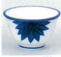
390-11-24B 530円 大輪菊反干茶 9.2×6cm