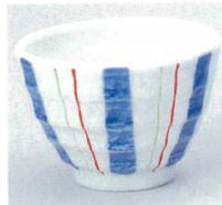
390-1-20B 620円 色十草煎茶 120入 9.3×6.5cm