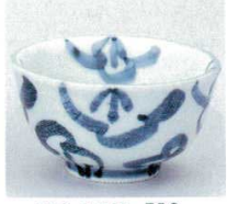
390-6-73B 510円 布目内外大梅煎茶 120入 9.5×5.4cm