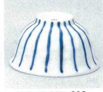
390-18-70B 460円 厚口一珍反煎茶 180入 9.3×5.3cm