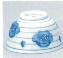
390-7-74B 500円 一珍ウス梅厚口反煎茶 150入 9×5.3cm