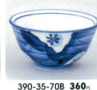
390-35-70B 360円 夕ミ梅反煎茶厚口 200入 9.8×5.2cm