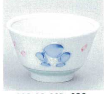
390-12-32B 480円 厚口一珍梅花反煎茶 140入 9.4×5.3cm