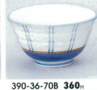
390-36-70B 360円 腰ゴス二本線反煎茶(厚口) 180入 9.8×5.4cm