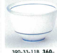
390-33-11B 360円 童厚口反煎茶 120入 9.2×5.8cm