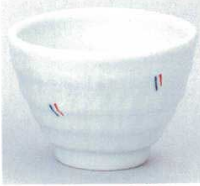
390-3-20B 620円 かすり煎茶 120入 9.3×6.5cm