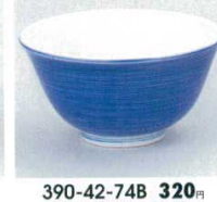
390-42-74B 320円 千段呉須厚口反煎茶 180入 9.8×5.4cm