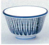
390-10-24B 530円 格子反干茶 9.2×6cm