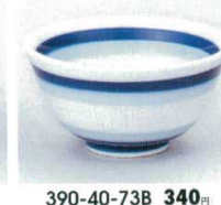
390-40-73B 340円 二色筋厚口反煎茶 180入 9.8×5.4cm