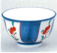
390-4-74B 600円 錦間取花厚口煎茶 150入 9×5.3cm