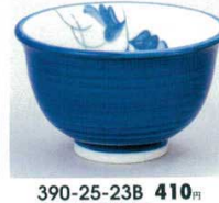
390-25-23B 410円 呉須巻中菊厚口 160入 9.5×5.5cm