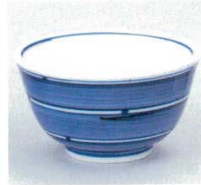
390-14-74B 460円 ライン水玉厚口反煎茶 180入 9.2×5.2cm