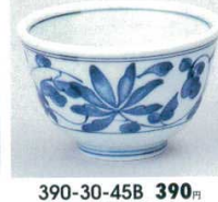
390-30-45B 390円 鉄線厚口反煎茶 160入 9×5.6cm 180cc