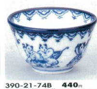
390-21-74B 440円 唐子内絵厚口煎茶180入 9.5×5.7cm