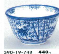
390-19-74B 440円 竹林内絵厚口反煎茶180入 9.5×5.5cm