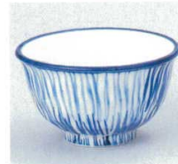
390-13-70B 460円 口クベハケメ反煎茶(厚口) 180入 9.3×5.3cm