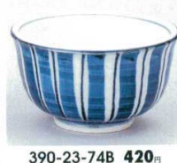
390-23-74B 420円 親子十草2.8反煎茶 180入 8.8×5cm