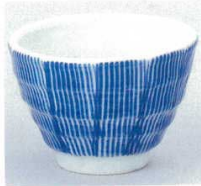
390-2-20B 620円 くし目煎茶 120入 9.3×6.5cm