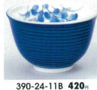
390-24-11B 420円 コス巻八千厚口反煎茶 120入 9.2×5.8cm