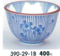
390-29-1B 400円 桜十草反煎茶 120入 9×5.7cm