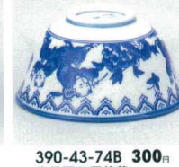
390-43-74B 300円 唐子厚口反煎茶 180入 9.8×5.2cm