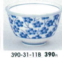
390-31-11B 390円 梅散厚口反煎茶 120入 9.2×5.8cm