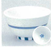
390-16-74B 460円 見込梅厚口反煎茶 180入 9.2×5.2cm