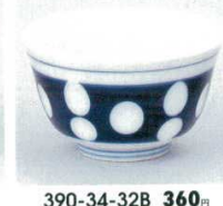
390-34-32B 360円 ルリ水玉厚口反干茶 140入 8.6×5.2cm