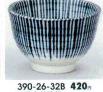
390-26-32B 420円 千段十草煎茶 140入 9.5×6cm