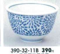
390-32-11B 390円 たご唐草厚口反干茶 120入 9.2×6.2cm