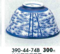
390-44-74B 300円 竹林厚口反煎茶 180入 9.8×5.2cm