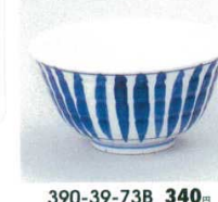
390-39-73B 340円 十草厚口反煎茶 150入 10×5.3cm