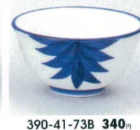
390-41-73B 340円 大輪菊厚口反煎茶 150入 10×5.3cm