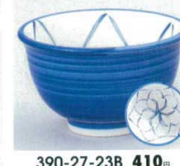
390-27-23B 410円 呉須巻中網煎茶厚口 160入 9.5×5.5cm