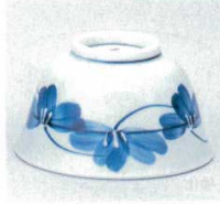
390-15-76B 460円 青磁青い花厚口反煎茶 120入 9.3×5.3cm