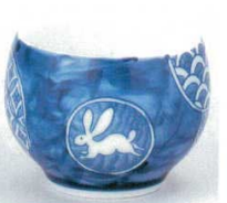
391-23-70B 420円 京祥瑞玉湯呑 10×12入 8×6cm