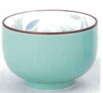
391-22-43B 500円 ヒスイカサブランカ湯呑 200入 8.1×5.5cm 175cc