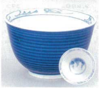
391-9-43B 480円 干段内ぶどう 紺反煎茶 160入 9×5.6cm