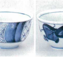
391-39-1B 330円 祥瑞反煎茶 160入 8×5cm