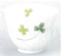
391-5-32B 630円 白磁ウェーブ型クローバー煎茶 140入 7.8×5.6cm