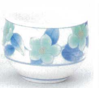
391-36-24B 230円 新山茶花玉湯呑 160入 7.2×6cm