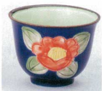
391-3-45B 670円 ルリ赤山茶花反煎茶 20×6入 8×6cm 135cc