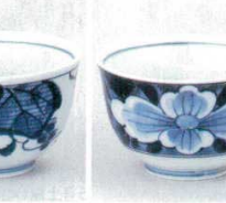
391-40-1B 330円 葡萄反煎茶 160入 8×5cm