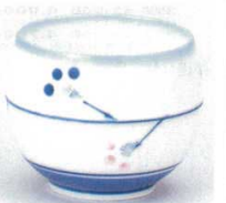
391-30-45B 320円 白磁早春梅玉湯呑 20×7入 7×6.5cm