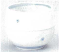
391-25-1B 330円 梅彫玉湯呑 20×6入 7×6.5cm