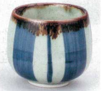
391-33-32B 240円 洪草太トクサ玉湯呑 140入 6.3×6.3cm