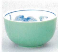
391-1-43B 1,000円 ヒスイ内ぶどう反煎茶 10×12入 8.5×5cm