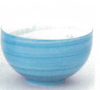
391-24-32B 480円 ブルー浮梅平丸型煎茶 140入 8.8×5cm