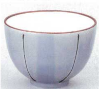
391-14-1B 400円 グレーサビ十草玉湯呑 120入 8×5.8cm