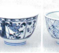
391-38-32B 340円 間取り玉露煎茶 200入 6.2×4.6cm