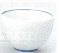
391-18-43B 280円 青白青地夏目煎茶 200入 8.2×5.7cm 190cc