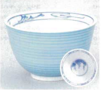
391-10-43B 480円 干段内ぶどうトルコ反煎茶 160入 9.1×5.6cm