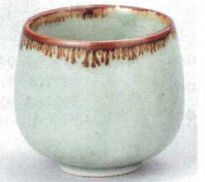
391-34-32B 220円 洪草口茶流玉煎茶 140入 6.3×6.3cm