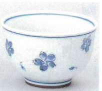
391-6-43B 550円 小花反煎茶 200入 8.5×5.5cm