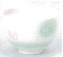
391-26-45B 330円 平安桜反煎茶 20×6入 8.2×5.7cm