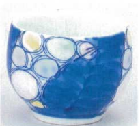
391-21-73B 500円 夢水玉玉湯呑 10×12入 7.5×9cm