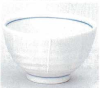
391-15-33B 380円 線一珍煎茶 120入 9×5.7cm