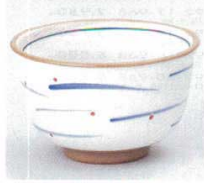
391-7-45B 550円 武蔵野反干茶 120入 7.6×5.5cm 170cc