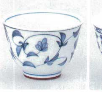
391-37-32B 400円 唐草反煎茶 160入 7.3×5.2cm