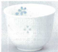
391-13-96B 400円 有田焼 ホタル小花仙茶 10×20入 8×6.2cm 160cc