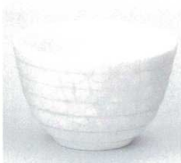
391-2-5B 750円 花づくし京型煎茶 10×12入 8×5cm