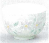
391-31-45B 300円 ヒワ色フローラ煎茶 20×8入 8×5.5cm 155cc