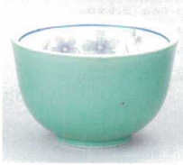
391-8-32B 520円 トルコスミレ3.0反煎茶 140入 8×5cm