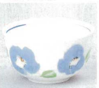
391-16-1B 360円 和紙椿干茶 180入 8.6×4.9cm