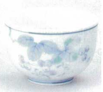
391-32-45B 300円 ぶどう煎茶 120入 8×5.5cm 155cc