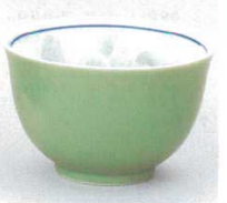
391-12-45B 400円 ヒスイミレ小反干茶 200入 8×5cm 120cc