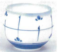
391-27-45B 330円 白磁めばえ玉湯呑 20×7入 7×6.5cm