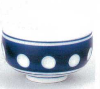
391-35-20B 280円 ルリ水玉汲出 30×5入 8×5.5cm