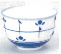
391-28-1B 330円 染付めばえ煎茶 120入 8.4×5.5cm