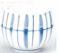
391-29-45B 320円 白磁十草玉湯呑 20×7入 7×6.5cm