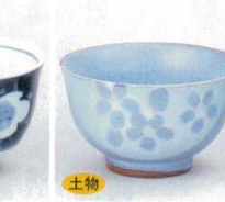
391-41-1B 330円 ふよう反煎茶 160入 8×5cm