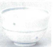
391-17-45B 310円 白磁刻梅反煎茶 20×8入 8.5×5.5cm 170cc