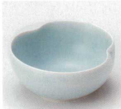
40-31-33B 1,950円 青白磁ひさご小鉢大 100入 10.5×10.2×4.7cm