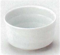
40-17-1B 1,700円 青白瓷六兵衛3.8小鉢 60入 11×6.4cm