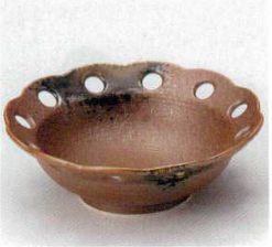
40-4-52B 1,400円 南蛮織部花型小鉢 80入 13.5×4.5cm