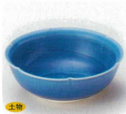
土物 40-15-33B 1,350円 トルコ輪花玉割 80入 12.7×4.7cm