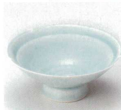
40-14-52B 1,640円 青白磁輪花小鉢 80入 12.5×5.3cm