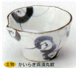
土物 かいらぎ呉須丸紋 40-6-52B 1,250円 巻貝4.0并 60入 12.3×6.0cm 40-7-52B 1,450円 巻貝4.5并 50入 13.9×13.5×8.3cm