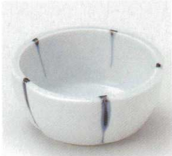
40-32-14B 830円 古染十草3.0小鉢 100入 10.2×4.5cm