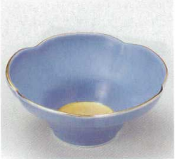
40-3-93B 1,500円 有田焼 五軸金紫花型小鉢 5×16入 13.5×5.5cm