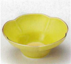
40-2-93B 1,500円 有田焼 五軸金緑花型小鉢 5×16入 13.5×5.5cm