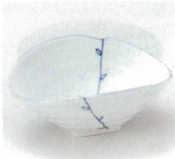
40-16-22B 1,300円 若芽結び菱形小鉢 50入 14.8×11.3×6cm