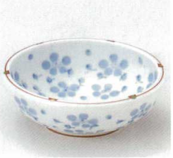
40-5-93B 1,350円 有田焼 梅花話小鉢 5×16入 13.5×4.5cm