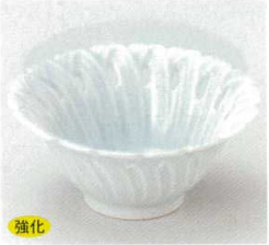
強化 40-18-74B 1,200円 青白磁かごめ3.6小鉢 100入 11×4.9cm