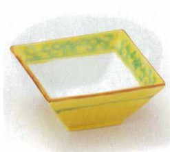
40-23-33B 1,850円 黄交趾唐草角小鉢 100入 9×9×4.2cm