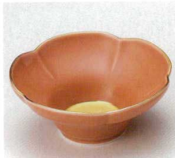
40-1-93B 1,500円 有田焼 五軸金オレンジ花型小鉢 5×16入 13.5×5.5cm