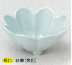
強化 翡翠(強化) 40-12-31B 660円 菊割小付 80入 8.8×3.9cm 40-13-31B 1,450円 菊割小鉢 100入 12.5×5.7cm