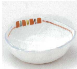
40-30-23B 1,050円 赤絵十草平鉢 100入 10.8×11.4×3.8cm