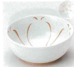
40-28-93B 1,100円 有田焼 花ひらり小鉢 5入 12×5cm