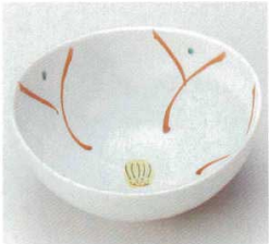
40-9-31B 790円 山茶花楕円4.0小鉢 60入 13.5×13×6.2cm