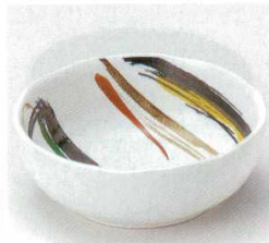
40-29-1B 680円 なると3.8小鉢 80入 12×4.5cm