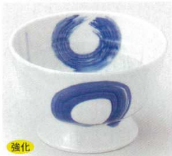
強化 40-8-26B 1,480円 呉須丸紋高台4.5鉢 60入 12.5×8cm