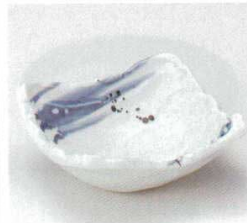
40-34-33B 760円 涼風14cm小鉢 80入 14×14×5.7cm