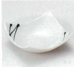
40-37-22B 730円 白袖黒一珍四方上り鉢(小) 80入 13×13×4.5cm