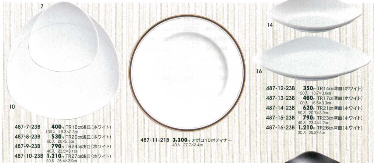
487-7-23B 400円 TR16cm浅皿(ホワイト) 100入 16.3×2.3cm 487-8-23B 530円 TR20cm浅皿(ホワイト) 60入 20×2.5cm 487-9-23B 790円 TR24cm浅皿(ホワイト) 40入 23.5×3.1cm 487-10-23B 1,210円 TR27cm浅皿(ホワイト) 30入 26.4×2.9cm