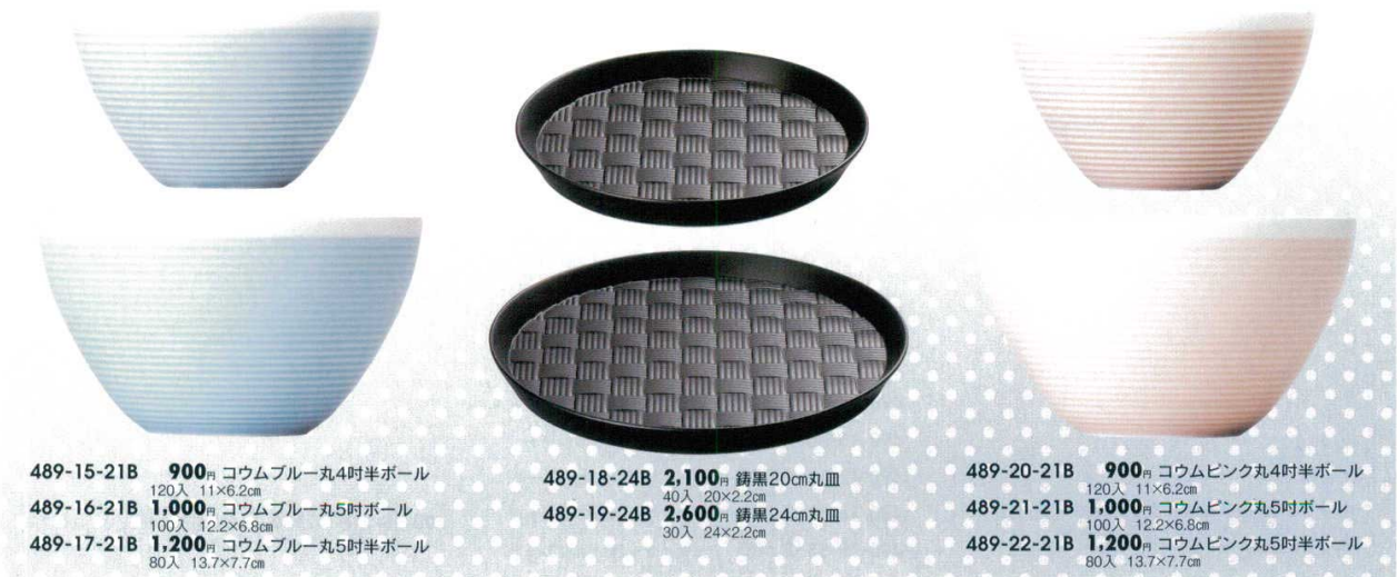
489-15-21B 900 円 コウムブルー丸4時半ボール 120入 11×6.2cm