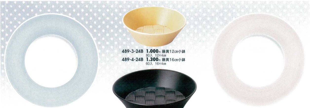
489-1-21B 2,300 円 コウムブルー11吋ディナー皿 40入 28×2.7cm