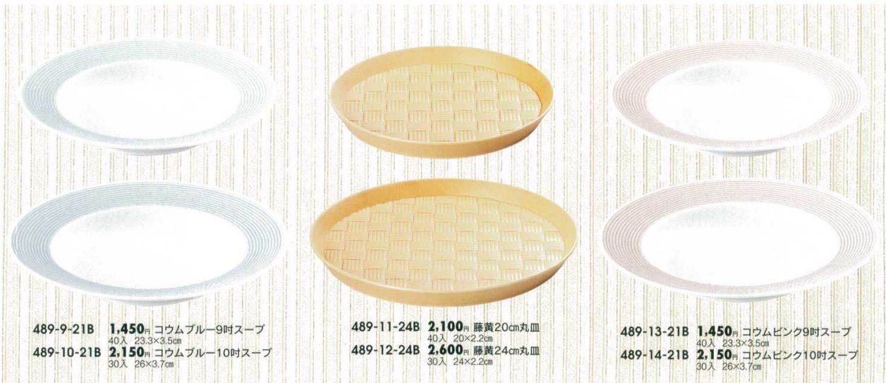
489-9-21B 1,450 円 コウムブルー9吋スープ 40入 23.3×3.5cm