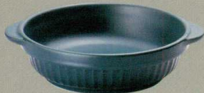
501-11-21B 1,000円 手付緑レンジボール 60入 18.5×15.7×4.7cm