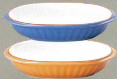
501-16-52B 1,480円 ブルーカレー皿 40入 24.5×17.2×4.8cm