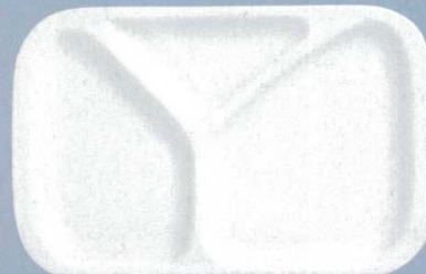
501-15-32B 2,000円 Y長角ランチ皿 30入 29×18.8×2.4cm