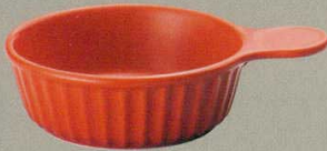
501-4-21B 900円 片手赤レンジボール 60入 18.5×13.5×5cm