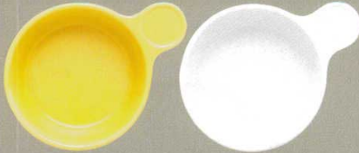
501-1-21B 900円 片手黄レンジボール 60入 18.5×13.5×5cm