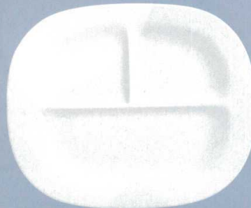
501-13-32B 2,000円 角ランチ皿 30入 27×22.2×2.8cm