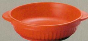
501-12-21B 1,000円 手付赤レンジボール 60入 18.5×15.7×4.7cm