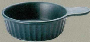
501-3-21B 900円 片手緑レンジボール 60入 18.5×13.5×5cm