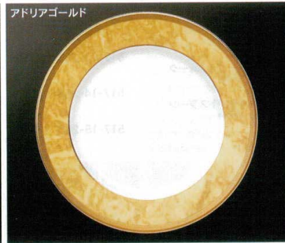
アドリアゴールド

強化 518-13-21B 5,100円 10時ディナー皿 40入 25.8×2.3cm 518-14-21B 7,750円 11時パーティー皿 30入 28.5×2.5cm