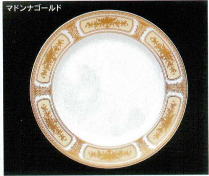
マドンナゴールド

518-9-21B 5,100円 10時ディナー皿 40入 25.4×2.7cm 518-10-21B 8,000円 12時チョップ皿 30入 31.1×3.5cm