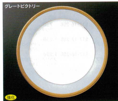
グレートビクトリー

518-11-21B 5,100円 10時ディナー皿 40入 25.4×2.7cm 518-12-21B 8,000円 12時チョップ皿 30入 31.1×3.5cm