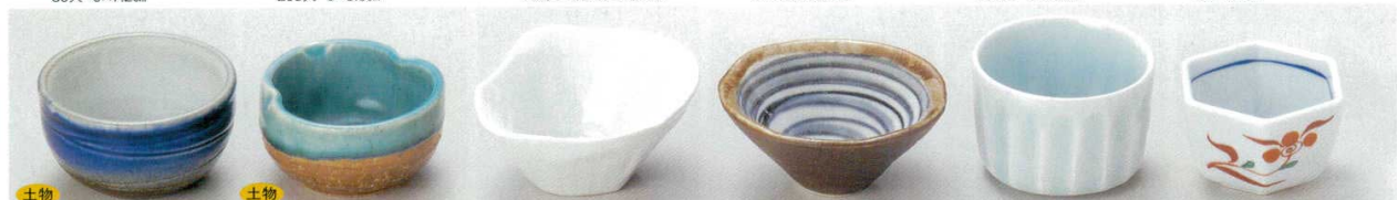
土物 58-20-1B 780円 青吹小付 120入 8.2×4.5cm 58-21-21B 750円 ビード口瓢小鉢 100入 8.5×7.6×4.4cm 58-22-33B 720円 白釉十草彫3.3小付 120入 10×9×3.8cm 58-23-23B 730円 黒潮3.0円錐鉢 510入 9.5×4.5cm 58-24-1B 750円 青磁そぎ丸小鉢 120入 7.6×5cm 58-25-14B 750円 小花六角小付 120入 7.5×7.5×4.5cm