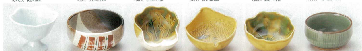
58-32-32B 780円 青白磁桔梗型高台珍味 60入 8.6×8×6.5cm 58-33-1B 690円 赤絵すだれ3.3ボール 80入 10.3×5.2cm 58-34-11B 670円 白菜小付 120入 9.5×8.2×4.3cm 58-35-11B 670円 イチヨウ小付 120入 9.2×9.6×4.5cm 58-36-11B 670円 蓮小付 120入 9.2×4.2cm 58-37-1B 680円 貫入春がすみ小付 160入 8.5×4.7cm