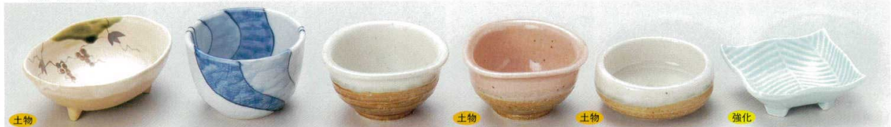
土物 58-8-74B 870円 志野ぶどう舟型小鉢 80入 12.3×9.3×4.5cm 58-9-70B 850円 きよみず3.0深小鉢 120入 8.5×6cm 58-10-20B 800円 粉引三角3.0小鉢 120入 9×9×4.8cm 58-11-1B 700円 ピンク三角小付 160入 9.2×5cm 58-12-20B 800円 粉引貫入丸小付 100入 8.4×3.5cm 58-13-31B 820円 翡翠(強化)四海波千代口 60入 8.1×8.1×2cm