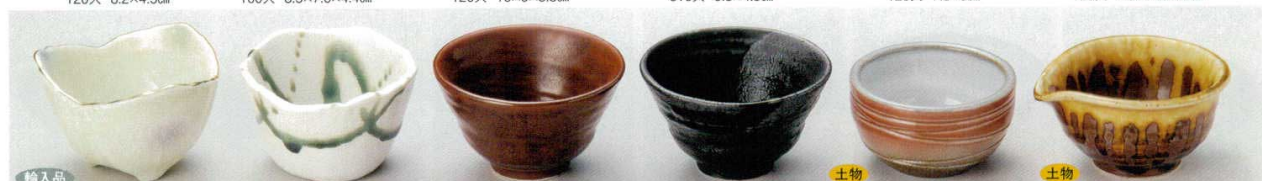
輸入品 58-26-21B 800円 三色吹淵金三葉型小鉢(小) 10×8入 9.2×6cm 58-27-22B 760円 白マツト織部流小付 100入 9.2×5.5cm 58-28-23B 700円 赤釉もえぎ3.0鉢 100入 9.4×5.4cm 58-29-23B 700円 ビードライン3.0鉢 100入 9.4×5.4cm 58-30-1B 780円 赤吹小付 120入 8.2×4.5cm 58-31-21B 750円 黄流片小鉢 100入 10×8.9×5cm