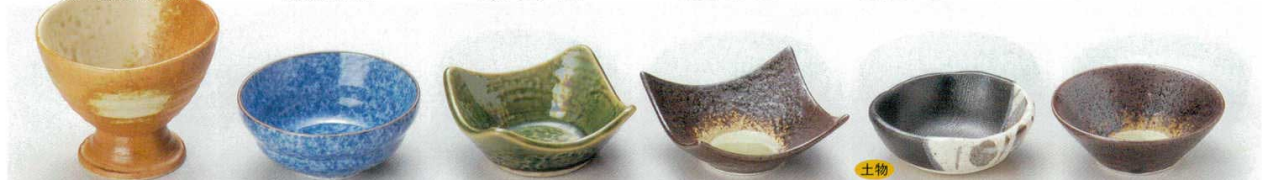
58-14-31B 720円 あけぼの高台小鉢 80入 9×7.2cm 58-15-45B 740円 墨吹段付小付珍味 200入 9×3.8cm 58-16-74B 840円 織部四角珍味 100入 8.6×8.6×3.8cm 58-17-24B 700円 石目型角小鉢(小) 8.2×8.2×3.5cm 58-18-23B 780円 黒織部トクサ丸小鉢 150入 8.5×3cm 58-19-24B 700円 石目型丸小鉢(小) 8.7×3.2cm