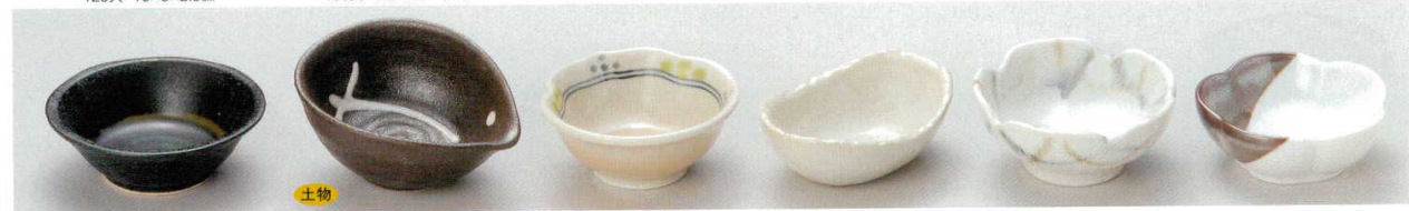
62-19-5B 350円 岩清水(黒)3.0小付 120入 9.5×3.3cm 62-20-21B 320円 錦イラホ卵型3.5小付 120入 10.5×8.3×4.5cm 62-21-74B 390円 萩風早春顔型豆千代口 160入 9×3.8cm 62-22-5B 380円 粉引ちぎり楕円3.0鉢 120入 9.5×7.1×3.3cm 62-23-73B 370円 ウノフ十草花形珍味 200入 9×4cm 62-24-14B 360円 白志野梅型小皿 300入 8.4×3cm