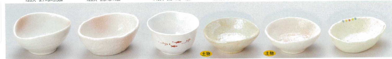
62-38-43B 350円 弥生うずず小付 160入 10×8.2×4.6cm 62-39-45B 350円 晴白雪小付 120入 10.8×8.5×4cm 62-40-11B 330円 流水さかな梅型小付 100入 8.3×5cm 62-41-74B 390円 真珠豆千代口 200入 8.7×8.2×3.3cm 62-42-74B 300円 桜志野豆千代口 200入 8.7×8.3×3cm 62-43-73B 300円 点あそび変形小皿 150入 9.5×7.8×3cm