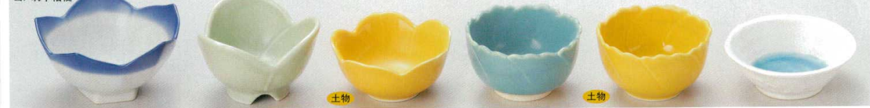
62-25-21B 330円 3.3珍味 150入 8.5×4cm 62-26-21B 390円 3.6珍味 120入 10×5.5cm 62-27-74B 360円 ヒワ三ツ葉3.3鉢 120入 8.5×5.5cm 62-28-20B 350円 やまぶき桜型小付 120入 8.5×4cm 62-29-20B 360円 淡緑輪花小付 120入 8.2×4.7cm 62-30-20B 320円 やまぶき牡丹型小付 120入 8×4.7cm 62-31-5B 350円 岩清水(白)3.0小付 120入 9.5×3.3cm