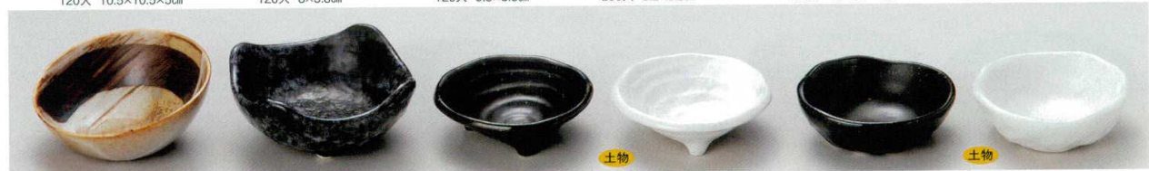
62-13-13B 340円 流水小付 120入 10×5×2.5cm 62-14-45B 390円 白雪夕タキ四ツ山小付 100入 9.3×9.3×4.3cm 62-15-5B 340円 黒桜姫小付満三ツ足 240入 8.8×2.7cm 62-16-5B 380円 化粧刷毛姫小付満三ツ足 240入 8.8×2.7cm 62-17-5B 340円 黒桜姫小付たたら 240入 8.6×2.6cm 62-18-5B 380円 化粧刷毛姫小付たたら 240入 8.6×2.6cm