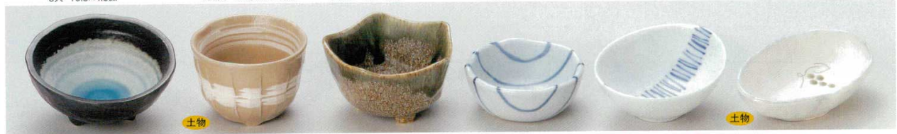
62-7-32B 340円 ブルー波型三ツ足珍味 120入 10.5×10.5×5cm 62-8-33B 320円 白刷毛ソギ小付 120入 8×5.8cm 62-9-20B 360円 織部塗り分五角3.0小鉢 120入 9.5×5.5cm 62-10-33B 440円 手描きストライプ千代口 200入 8.2×3.3cm 62-11-24B 420円 流星小付 100入 10×8.5×4cm 62-12-33B 430円 マスカットだ円珍味 120入 12×7.2×3.2cm