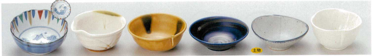
62-1-93B 440円 十草山水小付 5入 10.5×4.3cm 62-2-1B 400円 織部スキ小鉢 160入 10.3×10.7×5cm 62-3-11B 440円 黄瀬戸小付 200入 11×4.2cm 62-4-25B 480円 銀彩ブルー3.5鉢 120入 11×3cm 62-5-45B 330円 淵組合わせ小付 120入 10.6×10.3×3.5cm 62-6-5B 380円 白釉三方小付 120入 9.5×5.2cm