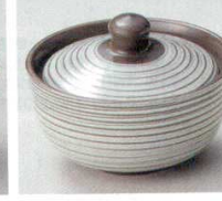
66-30-1B 800 円 グリーン千段蓋付珍味 20×6入 8.5×6cm