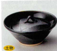
土物 66-7-52B 1,480 円 錆黒三角紋蓋付珍味入 80入 9.6×4.5cm