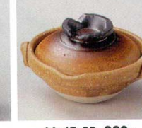
66-47-5B 920 円 伊賀錆鍋型珍味入 100入 8.5×7.7×5.2cm