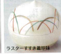
66-20-11B 1,350 円 (小) 100入 5×5cm 66-21-11B 1,600 円 (大) 100入 6.5×6cm