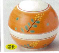
強化 66-12-74B 1,450 円 赤絵萩蓋付珍味 100入 7×6cm