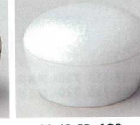
66-42-5B 630 円 唐草血上豆珍味白磁 120入 5×3cm