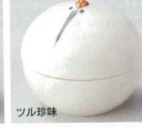
66-22-23B 1,500 円 (小) 150入 5×4.5cm 66-23-23B 1,700 円 (大) 100入 6.5×6cm