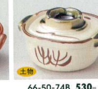
土物 66-50-74B 530 円 織部錆鍋型珍味(小) 10×15入 7×6×3cm