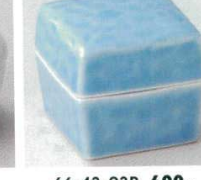
66-43-23B 600 円 靑角蓋付珍味 150入 4.2×4.2×4cm