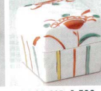
66-36-23B 1,500 円 飛鳥正角蓋付珍味 150入 4.2×4.2×4cm