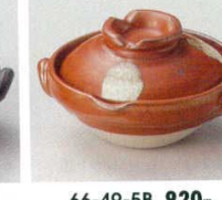
66-49-5B 920 円 辰砂釉鍋型珍味入 100入 8.5×7.7×5.2cm