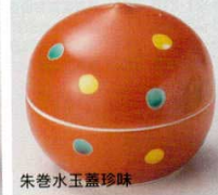
66-16-11B 1,600 円 (小) 100入 5×5cm 66-17-11B 1,750 円 (大) 100入 6.5×6cm