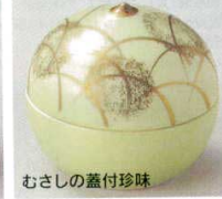
66-18-23B 1,500 円 (小) 150入 5×4.5cm 66-19-23B 1,700 円 (大) 100入 6.5×6cm