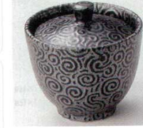
66-39-5B 1,250 円 唐草血上珍味黒釉 10×10入 6.2×6cm