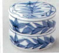
66-10-14B 1,700 円 桔梗二段珍味(小) 60入 7×5.8cm