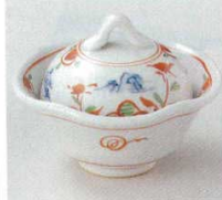
66-3-20B 2,350 円 山水万層蓋付珍味 80入 10.5×8.5cm