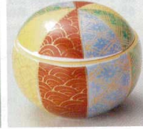
66-11-22B 3,100 円 まり型風船模様珍味 100入 7×5.5cm