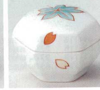
66-34-7B 1,750 円 春秋蓋付珍味 120入 7×6.5×4.5cm