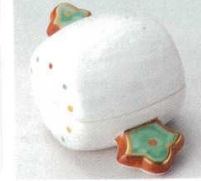
66-33-1B 2,000 円 錦こづち蓋付珍味 20×5入 10×6×5.2cm