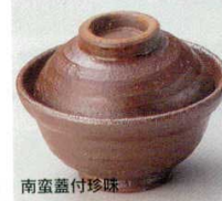
66-25-20B 1,450 円 (小) 7.8×5.8cm 66-26-20B 1,800 円 (大) 9.3×6.8cm