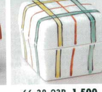
66-38-23B 1,500 円 赤絵格子角蓋付珍味 150入 4.2×4.2×4cm