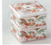
66-5-14B 2,100 円 花鳥二段珍味 50入 7×7×7.2cm