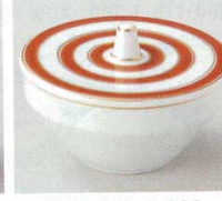
66-13-14B 1,800 円 コマ珍味 100入 7.4×5cm