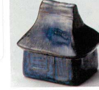
66-45-32B 900 円 なまご合掌蓋物 60入 8.5×7×9cm