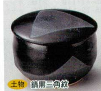
土物 66-8-52B 500 円 小付蓋 66-9-52B 1,750 円 (大) 120入 7.7×5cm