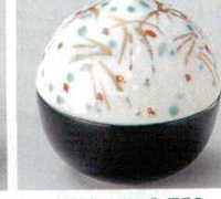
66-24-52B 1,750 円 塗分しだれ栗形珍味 120入 5×5.5cm