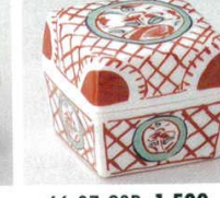
66-37-23B 1,500 円 赤絵花鳥角蓋付珍味 150入 4.2×4.2×4cm