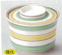
強化 66-2-52B 2,480 円 緑黄独楽筋蓋付小鉢 100入 8×6cm