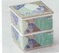
66-4-14B 2,100 円 緑彩小紋二段珍味 50入 7×7×7.2cm