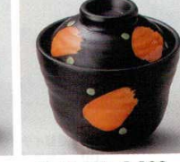
66-46-20B 1,100 円 黒マツト赤カスリ蓋付珍味 11×12入 6.5×6.8cm