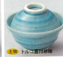
土物 66-27-20B 1,450 円 (小) 7.8×5.8cm 66-28-20B 1,800 円 (大) 9.3×6.8cm