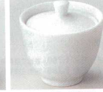
66-40-5B 1,250 円 唐草血上珍味白磁 10×10入 6.2×6cm