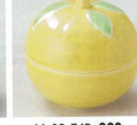
66-32-74B 920 円 黄ゆず蓋付珍味 80入 7.2×7cm