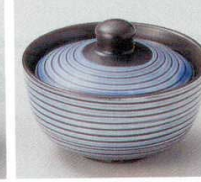
66-29-1B 800 円 紫千段蓋付珍味 20×6入 8.5×6.5cm