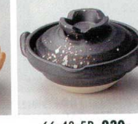
66-48-5B 920 円 錆白吹鍋型珍味入 100入 8.5×7.7×5.2cm