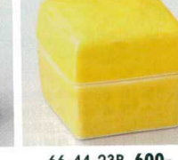
66-44-23B 600 円 靑角蓋付珍味 150入 4.2×4.2×4cm