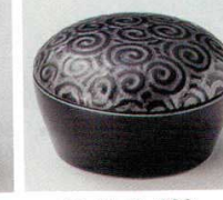
66-41-5B 630 円 唐草血上豆珍味黒釉 120入 5×3cm