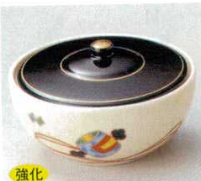
強化 66-1-52B 2,800 円 宝珠紋小蓋物 60入 9.4×5.5cm

特選和食器 和食器単品 和食器オープン 特選洋食器 洋食器オープン 洋食器単品 中華オープン 中華食器単品 四邑市方言の器 民芸の器 木竹製品その他