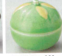
66-31-74B 920 円 ヒフゆず蓋付珍味 80入 7.2×7cm