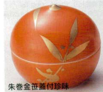
66-14-23B 1,500 円 (小) 150入 5×4.5cm 66-15-23B 1,700 円 (大) 100入 6.5×6cm