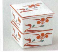
66-6-14B 2,100 円 小花二段珍味 50入 7×7×7.2cm