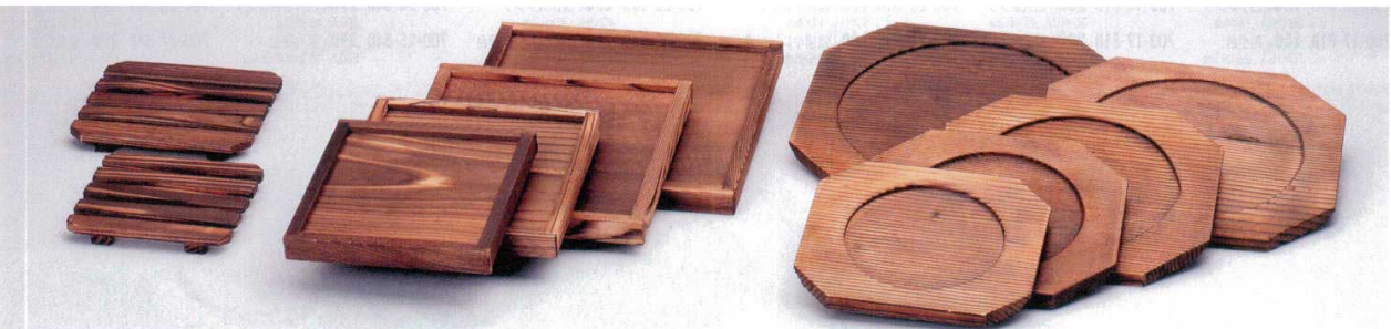
699-21-84B 340円 13cmイカダスノコ 240入 13×13×1.5cm 699-22-84B 410円 15cmイカダスノコ 240入 15×15×1.5cm