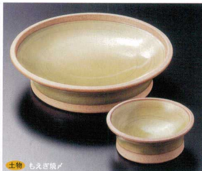
土物 もえぎ焼 7-9-22B 3,000円 高台刺身鉢 40入 15×3.7cm 7-10-22B 1,300円 高台千代口 100入 7.8×3cm