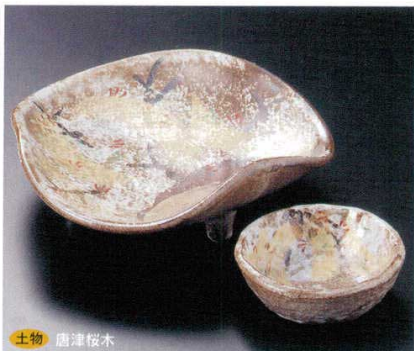
土物 唐津桜木 7-15-51B 3,100円 三ツ足刺身鉢 40入 16.3×15.5×5.5cm 7-16-51B 1,100円 千代口 150入 8.3×3cm