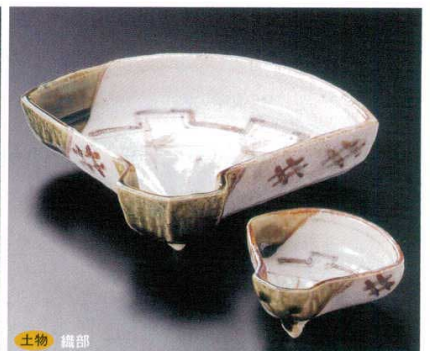
土物 織部 7-17-52B 4,520円 扇型向付三足 30入 18.5×14.5×4.5cm 7-18-52B 1,580円 扇型千代口三足 100入 8.5×7.5×3.8cm