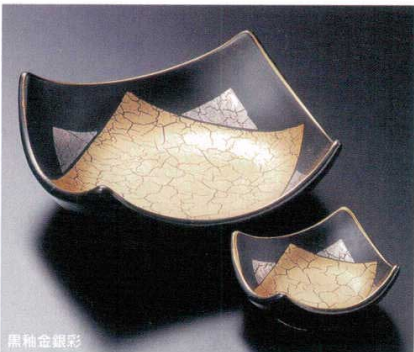
黒釉金銀彩 7-21-23B 3,350円 角刺身鉢 40入 16×16×5.7cm 7-22-23B 1,100円 角千代口 200入 7.9×7.9×3.5cm