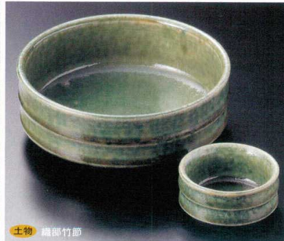
土物 織部竹節 7-3-52B 3,800円 5.5鉢 30入 16.2×6.3cm 7-4-52B 900円 千代口 100入 7.3×3.8cm