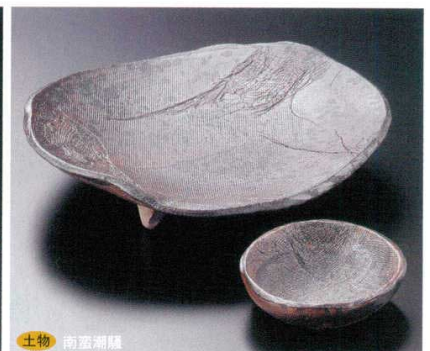
土物 南蛮潮羅 7-11-45B 3,800円 足付大皿(手造り)刺身 20入 20×17×3.2cm 7-12-45B 820円 (手造り)千代口 150入 9.8×9×3cm