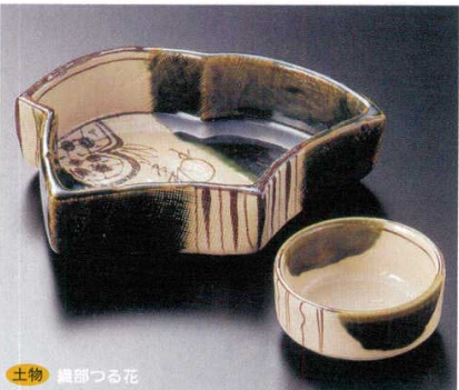
土物 織部つる花 7-13-74B 4,650円 千鳥刺身鉢 40入 15.5×13.1×4cm 7-14-74B 1,400円 丸千代久 150入 6.8×3.4cm