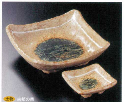
土物 古都の香 7-23-73B 2,150円 刺身鉢 40入 16.5×16.5×5.5cm 7-24-73B 450円 角千代口 200入 8×8×2.6cm