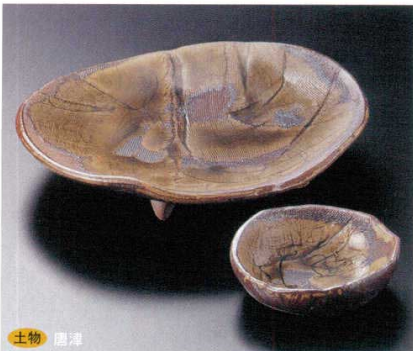
土物 唐津 7-7-45B 3,800円 楕円足付大皿(手造り)刺身 20入 20×17×3.2cm 7-8-45B 820円 (手造り)千代口 50入 9.8×9×3cm