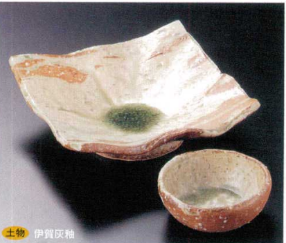
土物 伊賀灰釉 7-19-45B 4,300円 四方向付(手造り) 30入 16×15.5×3cm 7-20-45B 1,050円 千代口(手造り) 200入 8.3×3cm