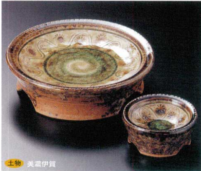
土物 美濃伊賀 7-1-52B 3,660円 高台足付6.0皿 30入 17.5×5cm 7-2-52B 1,100円 高台足付千代口 80入 8.5×4.5cm