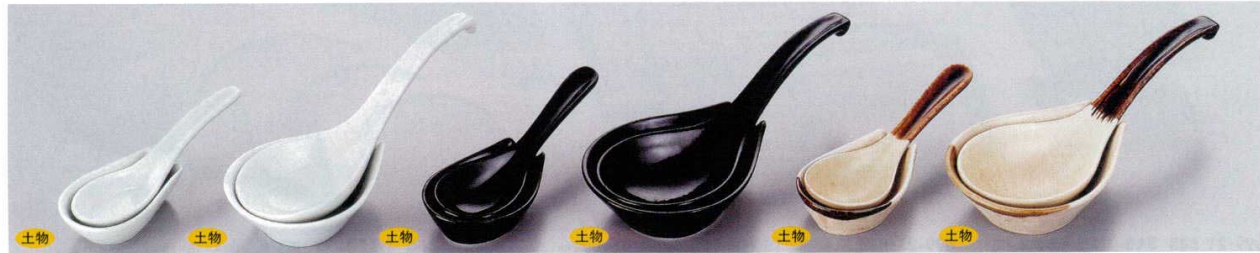
700-28-84B 165円 青地小レンゲ 480入 14×4cm 700-29-84B 165円 青地小受台 480入 8×5×2.4cm 700-30-84B 290円 青地大レンゲ 200入 19×7.2cm 700-31-84B 290円 青地大受台 200入 10.2×8.3×3.4cm 700-32-84B 320円 黒釉小レンゲ 400入 14.9×5cm 700-33-84B 300円 黒釉小受台 400入 8.7×6.3×2.8cm 700-34-84B 530円 黒釉大レンゲ 160入 21×7.6cm 700-35-84B 520円 黒釉大受台 160入 11.8×9.8×3.7cm 700-36-81B 340円 だんらん小レンゲ 50×10入 15×5cm 700-37-81B 270円 だんらん小台 50×10入 8.5×6.5cm 700-38-81B 560円 だんらん大レンゲ 20×10入 21×8cm 700-39-81B 470円 だんらん大台 20×10入 12×9.5cm