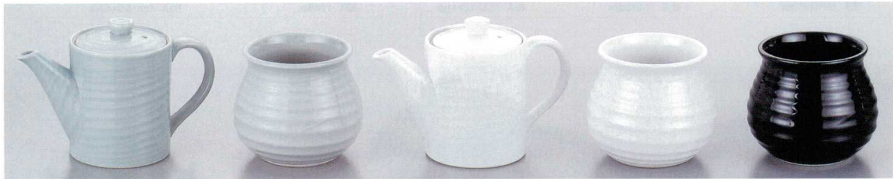
700-6-81B 2,800円 青磁汁次 6×6入 22.5×11.2×15.5cm 1000cc 700-7-81B 2,450円 青磁荒入 6×6入 12×13cm 700-8-81B 2,800円 白磁汁次 6×6入 22.5×11.2×15.5cm 1000cc 700-9-81B 2,450円 白磁荒入 6×6入 12×13cm 700-10-81B 2,450円 磁器天目荒入 6×6入 12×13cm