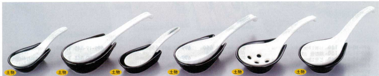
700-16-81B 160円 白小レンゲ 50×10入 14×4cm 700-17-81B 160円 黒小台 50×10入 8.5×5.3cm 700-18-81B 280円 白大レンゲ 20×10入 22×6.2cm 700-19-81B 280円 黒大台 20×10入 11×7.5cm 700-20-80B 160円 織部小レンゲ 80×6入 14×4cm 700-21-80B 160円 織部小レンゲ受台 80×6入 8.5×5.3cm 700-22-80B 280円 織部大レンゲ 40×6入 22×6.2cm 700-23-80B 280円 織部大レンゲ受台 40×6入 11×7.5cm 700-24-84B 290円 白穴あきレンゲ 200入 19×7.2cm 700-25-84B 290円 黒丸受台 200入 10.2×8.3×3.4cm 700-26-84B 290円 白おたま 200入 19×7.2cm 700-27-84B 290円 黒丸受台 200入 10.2×8.3×3.4cm