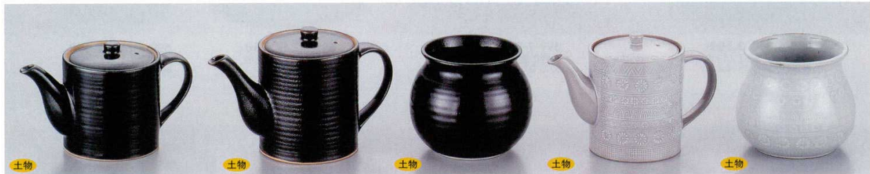
700-11-81B 2,400円 天目汁次(小) 6×6入 19.5×10.7×12cm 600cc 700-12-81B 2,600円 天目汁次(大) 6×6入 21.5×11×14cm 900cc 700-13-81B 2,300円 天目荒入 6×6入 11×11.5cm 700-14-81B 3,000円 三島手付汁次(大) 6×6入 19×10.5×13.3cm 700cc 700-15-81B 2,100円 三島荒入 6×6入 13.1×11.3cm