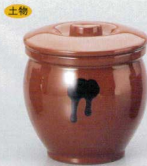
712-33-92B 1,680円 0.5号アメ色 1×24入 900cc