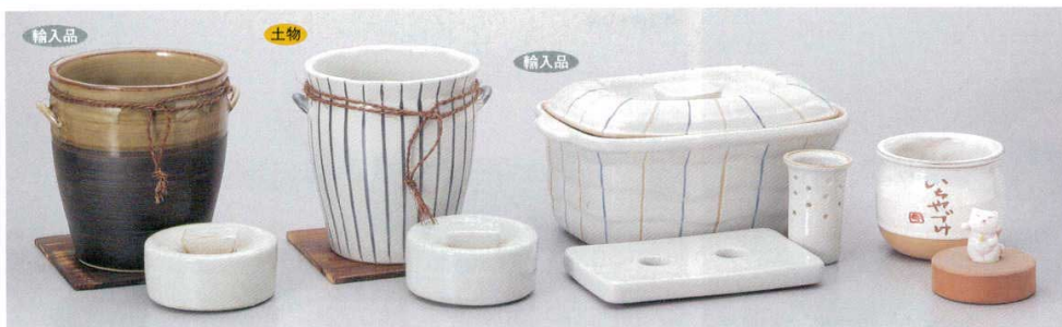
712-1-45B 3,100円 黒灰釉一夜漬 6入 14×15.5cm

特選和食器 和食器単品 和食器オープン 特選洋食器 洋食器オープン 洋食器単品 中華オープン 中華食器単品 四日市万古の器 民芸の器 木・竹製器その他