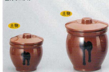
712-30-92B 970円 0.1号アメ色 1×80入 180cc