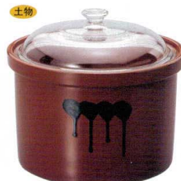
712-5-92B 5,400円 おふくろ 3.6糎 1×4入 3600cc