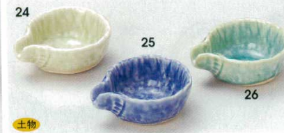
土物 72-24-32B 250 円 貫入片口珍味ヒワ 150入 7.2×6.6×3.2cm 72-25-32B 250 円 貫入片口珍味ブルー 150入 7.2×6.6×3.2cm 72-26-32B 250 円 貫入片口珍味トルコ 150入 7.2×6.6×3.2cm