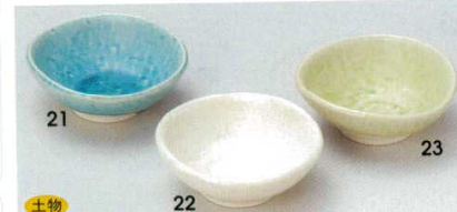
土物 72-21-73B 280 円 トルコ丸小皿 240入 8.7×8.2×3.2cm 72-22-73B 280 円 白志野丸小皿 200入 8.7×8.2×3.2cm 72-23-73B 280 円 ヒワ丸小皿 240入 8.7×8.2×3.2cm