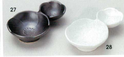
72-27-74B 590 円 黒マット梅型二品盛 100入 11.4×7×2.8cm 72-28-74B 590 円 白マット梅型二品盛 100入 11.4×7×2.8cm