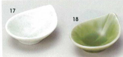
72-17-11B 500 円 もえぎしずく千代口 120入 9.3×7.4×3.2cm 72-18-11B 500 円 ヒスイしずく千代口 120入 9.3×7.4×3.2cm