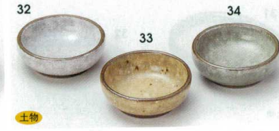
土物 72-32-20B 480 円 白かいらぎ豆千代口 200入 6.8×2.5cm 72-33-20B 480 円 アメかいらぎ豆千代口 200入 6.8×2.5cm 72-34-20B 480 円 ヒワかいらぎ豆千代口 200入 6.8×2.5cm