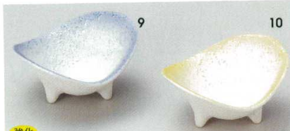
強化 72-9-74B 880 円 ブルー吹ラスターニツ切珍味 150入 8×7×3.7cm 72-10-74B 880 円 黄吹ラスターニツ切珍味 150入 8×7×3.7cm