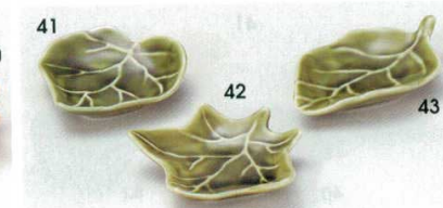
72-41-52B 380 円 オリベ軸ホブラ型珍味 300入 7×7×2cm 72-42-52B 380 円 オリベ軸かえで型珍味 300入 8.3×7.8×2cm 72-43-52B 380 円 オリベ軸みずぎ型珍味 300入 9×5.7×2cm