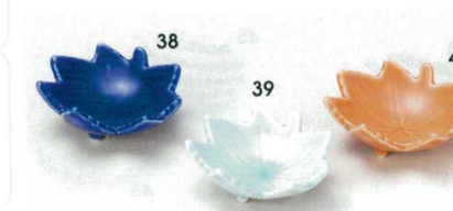
72-38-52B 390 円 ルリ楓型珍味 240入 7.5×7×2.6cm 72-39-52B 390 円 青磁楓型珍味 240入 7.5×7×2.6cm 72-40-52B 390 円 オレンジ楓型珍味 240入 7.5×7×2.6cm