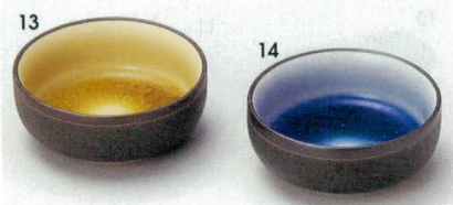
72-13-24B 250 円 アメ豆鉢 160入 7.7×3cm 72-14-24B 250 円 ブルー豆鉢 160入 7.7×3cm