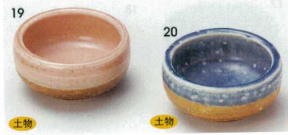
土物 72-19-21B 670 円 ピンク珍味 100入 7.1×3.4cm 72-20-21B 670 円 藍釉珍味 100入 7.1×3.4cm