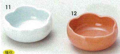
強化 72-11-14B 760 円 青白磁梅型珍味 160入 7.4×3.2cm 72-12-14B 760 円 紅梅型珍味 160入 7.4×3.2cm