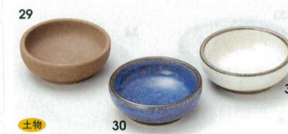
土物 72-29-20B 480 円 焼き大豆千代口 200入 6.8×2.5cm 72-30-20B 480 円 青かいらぎ豆千代口 200入 6.8×2.5cm 72-31-20B 480 円 粉引豆千代口 200入 6.8×2.5cm