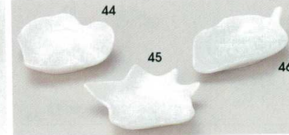
72-44-52B 380 円 白ボブラ型珍味 300入 7×7×2cm 72-45-52B 380 円 白かえで型珍味 300入 8.3×7.8×2cm 72-46-52B 380 円 白みずぎ型珍味 300入 9×5.7×2cm