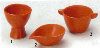
72-1-32B 720 円 磁器朱塗高台ワイン型珍味 70入 6.2×6.7cm 72-2-32B 470 円 磁器ドレッシング朱赤珍味 200入 8.6×6.2×3.2cm 72-3-32B 540 円 磁器朱塗エンゼルブリヂデザート 140入 9.3×7×5cm