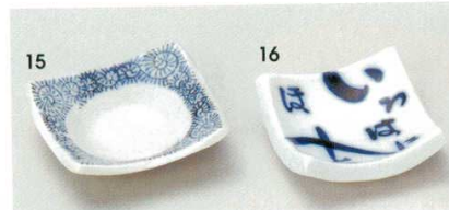
72-15-22B 780 円 染付唐草角珍味 100入 8.5×2cm 72-16-14B 520 円 いろは角珍味皿 200入 7.8×7.8×2.7cm