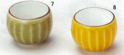
72-7-74B 670 円 緑釉面取珍味 620入 5.3×4.7cm 72-8-74B 670 円 黄釉面取珍味 120入 5.3×4.7cm