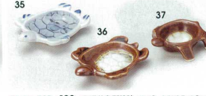
72-35-73B 430 円 御深井亀型珍味 250入 8.5×6.7×1.8cm 72-36-73B 430 円 鯖亀型珍味 250入 8.5×6.7×1.8cm 72-37-73B 430 円 鯖亀型四ツ足珍味 250入 6.6×5.7×2.2cm