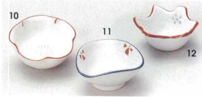
10 73-10-7B 470円 梅珍味 200入 6×2.7cm 11 73-11-7B 470円 小花珍味 200入 5.8×2.8cm 12 73-12-7B 470円 モミジ珍味 200入 6×2.5cm