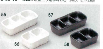
55 73-55-73B 600円 白マットミニ三品盛 200入 9.5×4.5×2cm 56 73-56-73B 470円 白マットミニ二品盛 300入 6.2×4×2cm 57 73-57-73B 600円 黒マットミニ三品盛 200入 9.5×4.5×2cm 58 73-58-73B 470円 黒マットミニ二品盛 300入 6.2×4×2cm