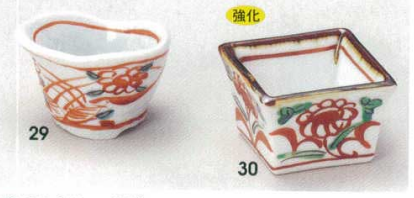
29 73-29-25B 940円 手描赤絵花鳥珍味 100入 5.5×4.8×3.5cm 30 73-30-74B 1,350円 赤絵角珍味 100入 4.8×4.8×3.3cm