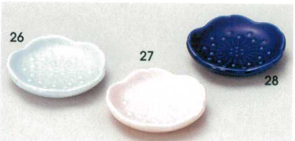
26 73-26-14B 180円 桜ブルー豆皿 300入 5.3×1cm 27 73-27-14B 180円 桜ピンク豆皿 300入 5.3×1cm 28 73-28-14B 180円 桜ルリ豆皿 300入 5.3×1cm