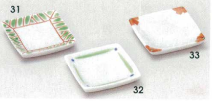
31 73-31-7B 450円 カゴメ御手塩皿 200入 5.5×5.5cm 32 73-32-7B 450円 スクウェア御手塩皿 200入 5.5×5.5cm 33 73-33-7B 450円 ミツ葉御手塩皿 200入 5.5×5.5cm