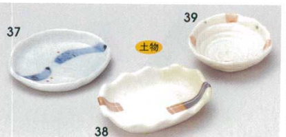
37 73-37-52B 350円 呉須筋青磁楕円小皿 200入 8.7×7.3×1.5cm 38 73-38-33B 290円 セピアライン波型千代口 240入 9.3×7×2cm 39 73-39-52B 350円 淵赤十草点グリーン豆小付 200入 7×2.1cm