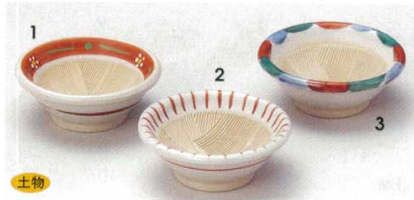
1 73-1-7B 730円 帯梅スリ鉢珍味 200入 7.5×3cm 2 73-2-7B 730円 トクサスリ鉢珍味 200入 7.5×3cm 3 73-3-7B 730円 波点紋スリ鉢珍味 200入 7.5×3cm