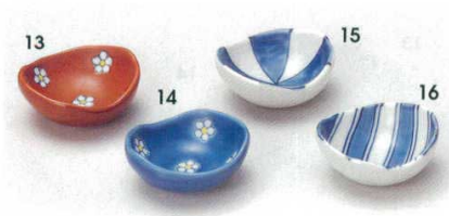
13 73-13-14B 600円 梅小紋楕円豆皿(R) 300入 5.7×5.1×2.3cm 14 73-14-14B 600円 梅小紋楕円豆皿(B) 300入 5.7×5.1×2.3cm 15 73-15-14B 500円 風船楕円珍味 300入 5.7×5.1×2.3cm 16 73-16-14B 500円 十草楕円珍味 300入 5.7×5.1×2.3cm