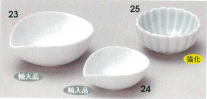
23 73-23-33B 350円 K-モードゆらぎSSボール 60入 9.2×7.6×3.8cm 24 73-24-33B 250円 K-モードゆらぎSSSボール 90入 7.2×5.8×2.8cm 25 73-25-74B 750円 靑白磁菊型千代口 120入 6.5×3cm