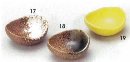
17 73-17-14B 320円 白流し楕円豆皿 300入 5.7×5.1×2.3cm 18 73-18-14B 320円 織部流し楕円豆皿 300入 5.7×5.1×2.3cm 19 73-19-14B 230円 黄楕円珍味 300入 5.7×5.1×2.3cm