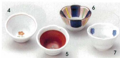
4 73-4-93B 500円 有田焼 赤い花珍味 10入 6×3.5cm 5 73-5-93B 500円 有田焼 朱巻珍味 10入 6×3.5cm 6 73-6-93B 520円 有田焼 彩珍味 10入 6×3.5cm 7 73-7-93B 450円 有田焼 染付梅珍味 10入 6×3.5cm