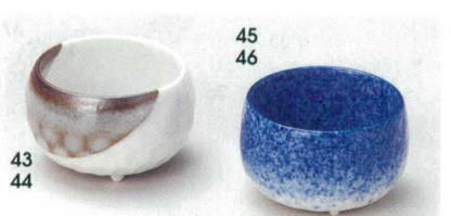
43 73-43-14B 430円 白志野三ツ足珍味(小) 300入 4.9×3cm 44 73-44-14B 480円 白志野三ツ足珍味(大) 300入 5.9×3.5cm 45 73-45-1B 380円 吹墨三ツ足珍味(小) 50×10入 4.7×2.9cm 46 73-46-1B 420円 吹墨三ツ足珍味(大) 240入 5.7×3.6cm