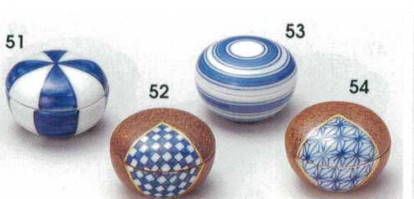
51 73-51-14B 840円 風船珍味 120入 4.8×3.2cm 52 73-52-14B 750円 市松珍味 200入 4.9×3.5cm 53 73-53-14B 840円 うず珍味 120入 4.8×3.2cm 54 73-54-14B 750円 さしこ珍味 200入 4.9×3.5cm