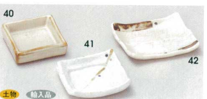
40 73-40-45B 290円 かすみ野正角切立小皿(小) 20×6入 5.7×5.7×1.8cm 41 73-41-52B 350円 ななめ鏡線角小皿 200入 7×6.8×2cm 42 73-42-52B 350円 クリームマット鏡線長角小皿 200入 8.8×6.8×1.5cm