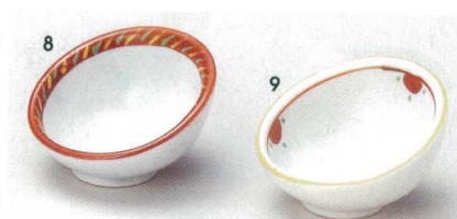
8 73-8-7B 750円 淵赤ナナム切珍味 200入 6.5×3.7cm 9 73-9-7B 750円 赤絵花ナナム切珍味 200入 6.5×3.7cm