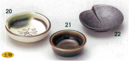
20 73-20-74B 220円 織部半月豆皿 300入 5.5×5.3×1.7cm 21 73-21-14B 260円 オリベのぞき 500入 4.4×1.7cm 22 73-22-45B 390円 鉄べーパーハス珍味皿 300入 5.4×5.4×1.5cm