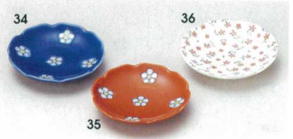
34 73-34-14B 530円 梅小紋B豆皿 400入 6.2×1cm 35 73-35-14B 530円 梅小紋R豆皿 400入 6.2×1cm 36 73-36-14B 280円 プチフラワー豆皿 400入 6.2×1cm