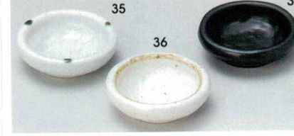
35 74-35-70B 200円 点織部玉淵珍味 180入 7.5×2.5cm 36 74-36-70B 200円 茶筋玉淵珍味 180入 7.5×2.5cm 37 74-37-70B 200円 黒釉玉淵珍味 200入 7.5×2.3cm