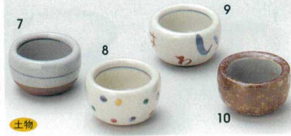
7 74-7-14B 400円 一本線珍味 200入 5.8×3.5cm 8 74-8-14B 680円 水玉珍味 200入 5.8×3.7cm 9 74-9-14B 680円 いろは珍味 200入 5.8×3.7cm 10 74-10-14B 380円 南蛮珍味 300入 5.8×3.5cm