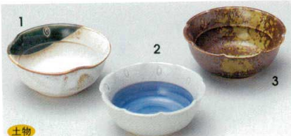
1 74-1-1B 260円 志野三彩珍味入 200入 8.8×3.6cm 2 74-2-1B 260円 呉須巻花ごよみ珍味 200入 9×3.5cm 3 74-3-1B 260円 南蛮吹珍味 200入 9×3.5cm