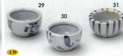
29 74-29-14B 360円 雪月花のぞき 500入 4.2×2.4cm 30 74-30-14B 360円 いろはのぞき 500入 4.2×2.4cm 31 74-31-14B 360円 十草のぞき 500入 4.2×2.4cm