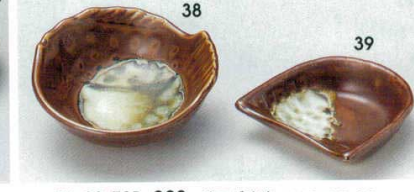
38 74-38-73B 320円 錆フグ珍味 200入 8.2×3.2cm 39 74-39-73B 370円 錆竹己珍味 200入 7×7.2×2cm