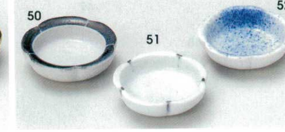
50 74-50-14B 420円 ゴス割り梅型珍味 500入 5.7×1.6cm 51 74-51-14B 360円 古染梅型珍味 500入 5.7×1.6cm 52 74-52-14B 380円 吹墨梅型珍味 500入 5.7×1.6cm