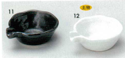
11 74-11-5B 340円 黒桜姫小付片口 240入 8×7×2.7cm 12 74-12-5B 380円 化粧刷毛姫小付片口 240入 8×7×2.7cm