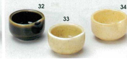
32 74-32-52B 180円 織部丸片押干代口 240入 4.2×2.5cm 33 74-33-52B 180円 梨地丸片押干代口 240入 4.2×2.5cm 34 74-34-52B 180円 志野丸片押干代口 240入 4.2×2.5cm