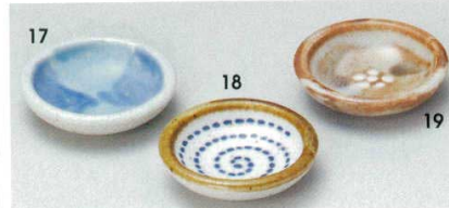
17 74-17-1B 210円 三彩豆小皿 300入 7.5×1.8cm 18 74-18-1B 210円 点うず豆小皿 300入 7.5×1.8cm 19 74-19-1B 210円 志野梅紋豆小皿 300入 7.5×1.8cm