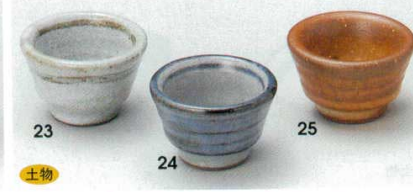
23 74-23-14B 380円 唐津珍味 300入 4.5×3cm 24 74-24-14B 380円 灰釉珍味 300入 4.5×3cm 25 74-25-14B 380円 志野珍味 300入 4.5×3cm