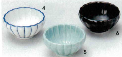
4 74-4-23B 350円 菊型十草珍味 150入 8.5×4cm 5 74-5-23B 280円 菊型ヒスイ珍味 150入 8.5×4cm 6 74-6-23B 280円 菊型天目珍味 150入 8.5×4cm