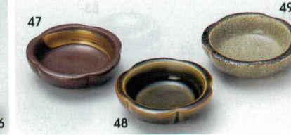
47 74-47-14B 520円 金ハケ梅型珍味 500入 5.7×1.6cm 48 74-48-14B 380円 オリベ梅型珍味 500入 5.8×1.8cm 49 74-49-14B 360円 新唐津梅型珍味 500入 5.7×1.6cm