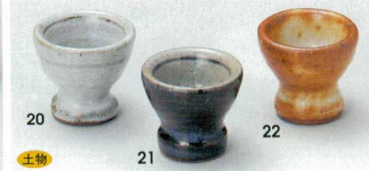
20 74-20-14B 420円 唐津高台珍味 300入 4.6×4.2cm 21 74-21-14B 420円 灰釉高台珍味 300入 4.6×4.2cm 22 74-22-14B 420円 志野高台珍味 300入 4.6×4.2cm