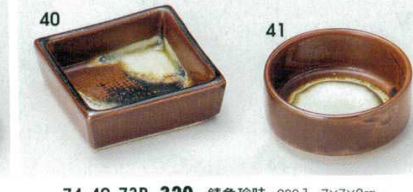
40 74-40-73B 320円 錆角珍味 200入 7×7×2cm 41 74-41-73B 320円 錆丸切立珍味 200入 7×3cm