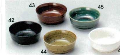
42 74-42-43B 220円 黒天目小付 200入 8×3cm 43 74-43-43B 220円 鉄赤小付 200入 8×3cm 44 74-44-43B 220円 唐津小付 200入 8×3cm 45 74-45-43B 220円 織部小付 200入 8×3cm 46 74-46-43B 220円 粉引小付 200入 8×3cm