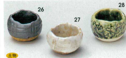
26 74-26-45B 560円 鉄袖 小丸珍味 手造 200入 4.5×4.3×3cm 27 74-27-45B 560円 粉引 小丸珍味 手造 200入 4.5×4.3×3cm 28 74-28-45B 560円 織部 小丸珍味 手造 200入 4.5×4.3×3cm