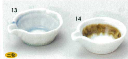
13 74-13-5B 380円 貫入三彩片口姫小付 240入 7.2×6.2×2.6cm 14 74-14-5B 380円 刷毛流し片口姫小付 240入 7.2×6.2×2.6cm