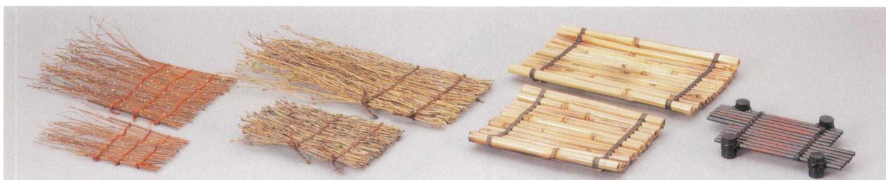
741-6-35B 1,400円 萩籐(小) 8×16cm 741-7-35B 2,000円 萩籐(大) 22×16cm