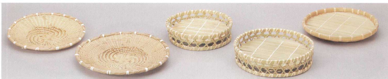
741-13-35B 1,250円 白竹そばザル(小) φ21×2.5cm