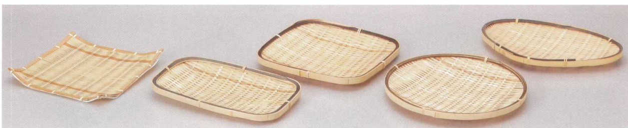
741-18-35B 500円 線入四海波 19×19cm