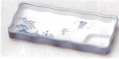
81-23-29B 1,800円 松花堂 山水波濁長角仕切皿 40入 22.5×11×2.5cm