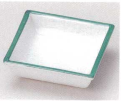
81-14-11B 730円 グリーン濁角鉢ミニ 120入 9.5×9.5×3cm