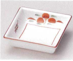
81-13-11B 900円 赤絵角鉢ミニ 120入 9.5×9.5×3cm