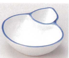
81-21-21B 650円 濁紺細仕切鉢 80入 12.4×10.9×3.5cm