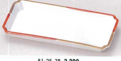
81-25-7B 2,200円 赤金長角鉢 40入 23×11.5×2.5cm