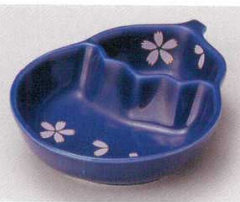
81-18-23B 1,430円 藍染桜吹雪茄子仕切皿 100入 13.5×10.7×3cm