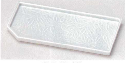
81-27-52B 820円 青磁母長角皿 60入 22.5×11.2cm