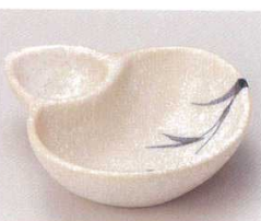
81-20-21B 650円 オレンジマット瓢仕切鉢 80入 12.4×10.9×3.5cm