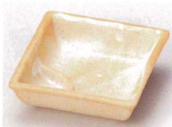
81-6-14B 600円 志野仕切鉢(小) 100入 9.4×9.4×3.1cm