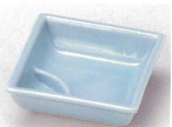
81-7-14B 750円 トルコ仕切鉢(小) 100入 9.3×9.3×3.1cm