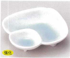
81-17-70B 1,000円 青白磁蛤松華堂 120入 11.3×3.4cm