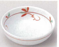
81-16-11B 700円 京小花丸鉢ミニ 120入 9.6×3cm