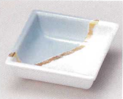
81-15-11B 950円 二色金彩角鉢ミニ 120入 9.3×3cm