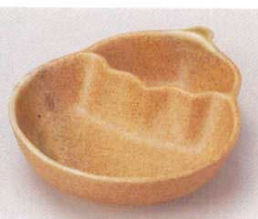
81-19-52B 1,380円 黄瀬戸なす形仕切皿 120入 13×10.7×3.2cm