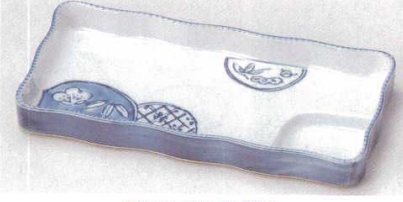
81-22-52B 1,650円 古染松竹梅7.5仕切皿 40入 23×11×2.4cm