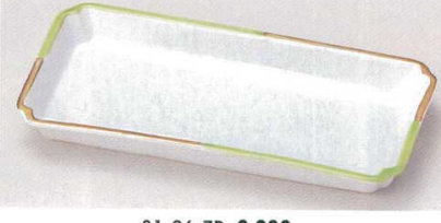
81-26-7B 2,200円 ヒワ金長角鉢 40入 23×11.5×2.5cm