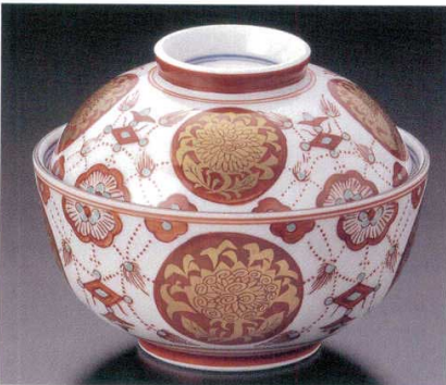
95-4-33B 5,100円 金蘭手瑠璃蓋向(小) 30入 11.2×8.5cm