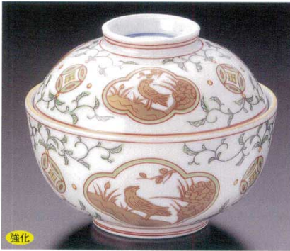
強化 95-1-52B 5,570円 唐草花鳥間取金彩蓋向付(小) 60入 11.2×9cm