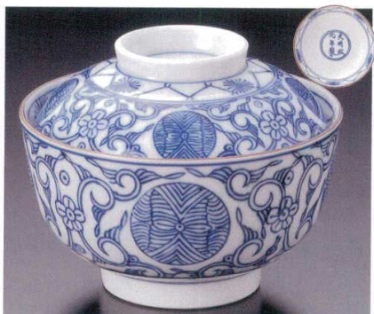
95-8-24B 4,500円 大明成化染付紋 60入 12×9.5cm