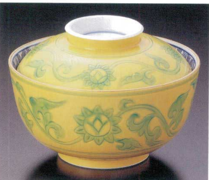
95-7-24B 4,500円 黄交趾蓋向 40入 12×9cm