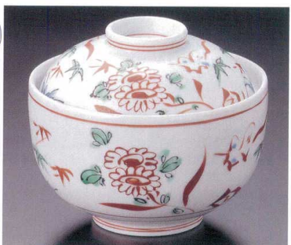
95-6-26B 4,600円 手描万歴円菓子碗 50入 10.2×8.5cm