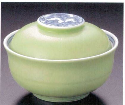
95-11-11B 3,900円 ヒワ吹松竹梅煮物碗 40入 12.5×9cm