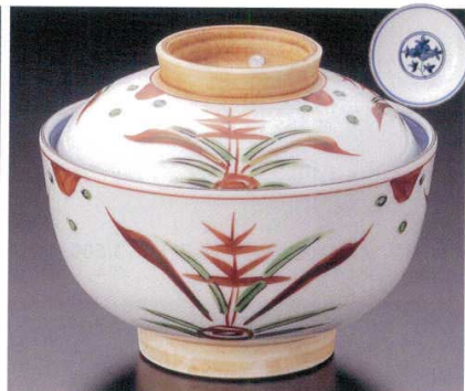
95-5-33B 5,100円 三方花蓋向 40入 12×9.5cm