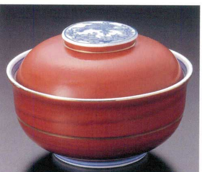
95-12-11B 3,900円 赤吹松竹梅煮物碗 40入 12.5×9cm