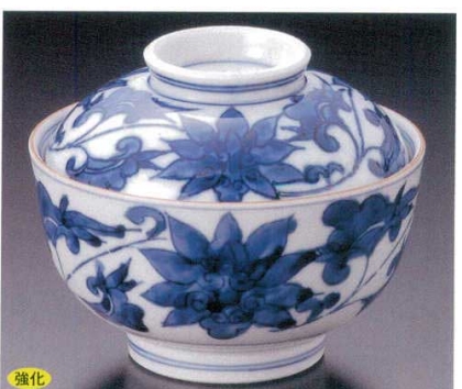
強化 95-9-52B 4,600円 染付唐草高浜蓋物 60入 11.8×9.6cm