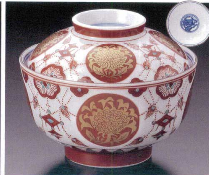
95-2-33B 5,500円 金蘭手瑠璃高台蓋向 30入 12×9.5cm