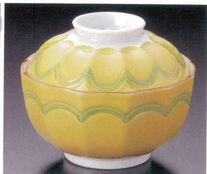
95-3-33B 5,500円 黄交趾古代蓋向 50入 10.5×8.5cm