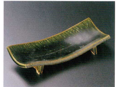
キ104-13-2 総織部 焼物皿(手造り) (27.5×11×5cm) ¥4,500 1213098021