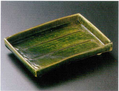
ツ104-31-2 総織部 切立焼物皿 (21.8×16.8×4cm) ¥3,800 1221107011