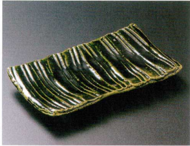
ツ104-11-2 織部 四ッ足長角皿(手造り) (26×15×2.7cm) ¥5,000 2221104011