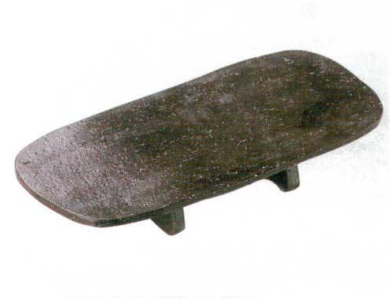
ワ104-21-2 渋釉 まな板皿 (31.5×14.5×5cm) ¥4,300 2209104021