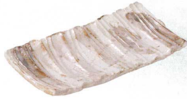
ツ104-12-2 白志野 四ッ足長角皿(手造り) (26×15×2.7cm) ¥5,000 2221104012