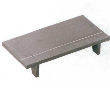
リ104-32-2 炭化土粉引一本線 マナ板皿 (29×14.7×5.2cm) ¥3,650 2129095032