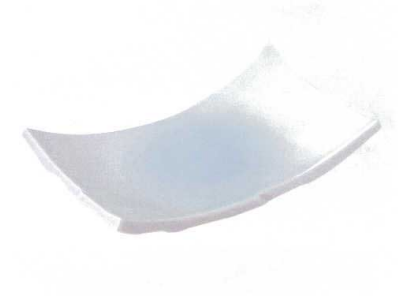
リ104-23-2 青白磁 井桁8.5長角皿 (25×16×5.2cm) ¥3,950 2029100041