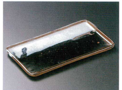
ワ104-33-2 天目白流 長角尺皿 (27.5×15.3×2cm) ¥3,750 2209104033