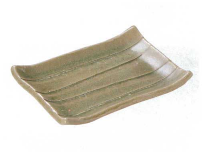
セ104-43-2 伊賀灰釉 7.0長角皿 (21.7×15.6×2.5cm) ¥3,500 1832107011