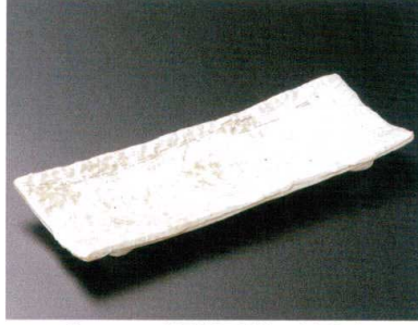
キ104-22-2 粉引櫛目 焼物皿(手造り) (28.5×11.5×3cm) ¥4,000 1813106021